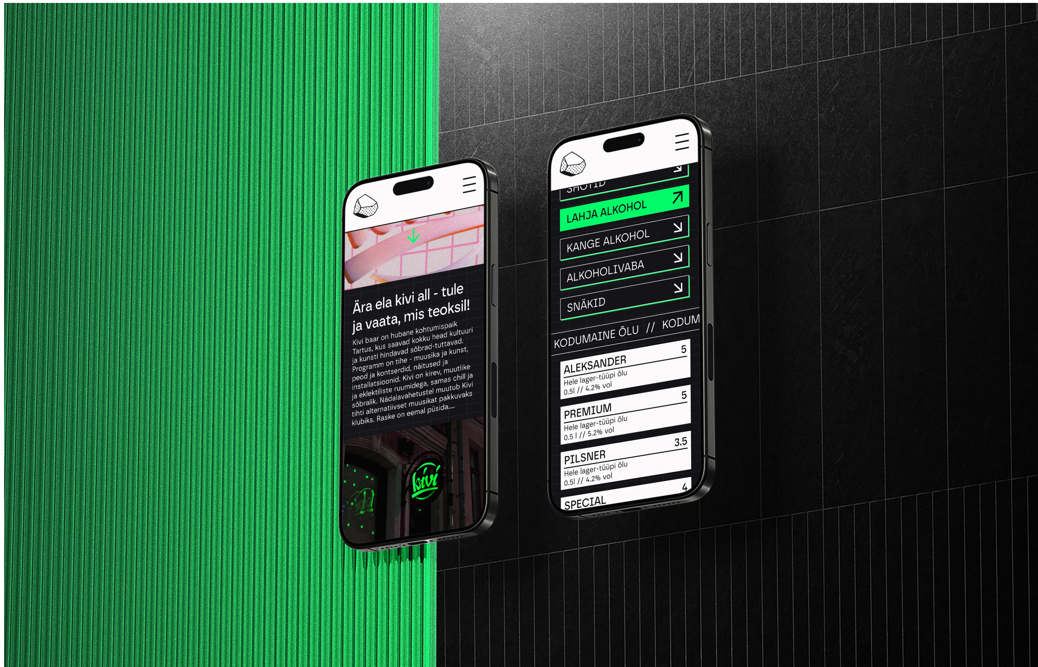
Kivi baari veebilehe mobiilivaade. Illustratsiooni autor: Markus Kliss

In the practical part of the thesis, I provided an overview of the project from pre-work to webpage construction and publication in the Webflow environment.