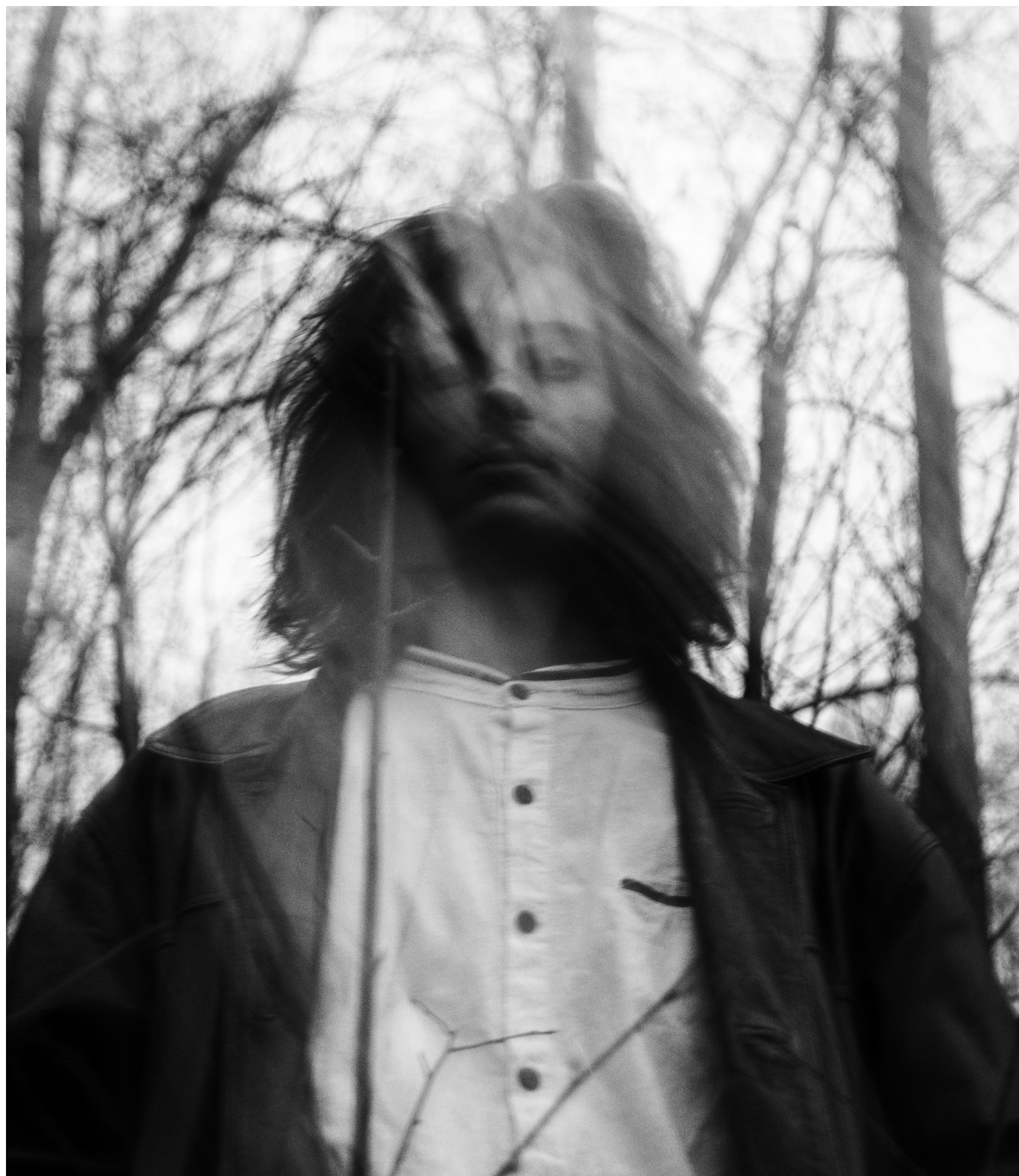
Töö autor.

Kivi baar on Tartus asuv alternatiivse elektroonilise muusika ja põrandaaluse kunsti kohtumispaik. Lõputöö raames disainisin veebilehe, mille abil on külastajal lihtne tutvuda joogimenüüga, olnud ja tulevaste üritustega ning osta Kivi baari meeneid. Andsin ülevaate kasutajakogemuse ja kasutajaliidese disainist, aatomipõhisest disainiprintsiibist, mobile first -disainist ning disainerist kui arendajast. Tutvustasin erinevate veebilehtede loojaid ( site builders ) ning uurisin, kui raske või kerge on neid kasutada disaineril, kes ei ole koodi kirjutamisega tuttav.