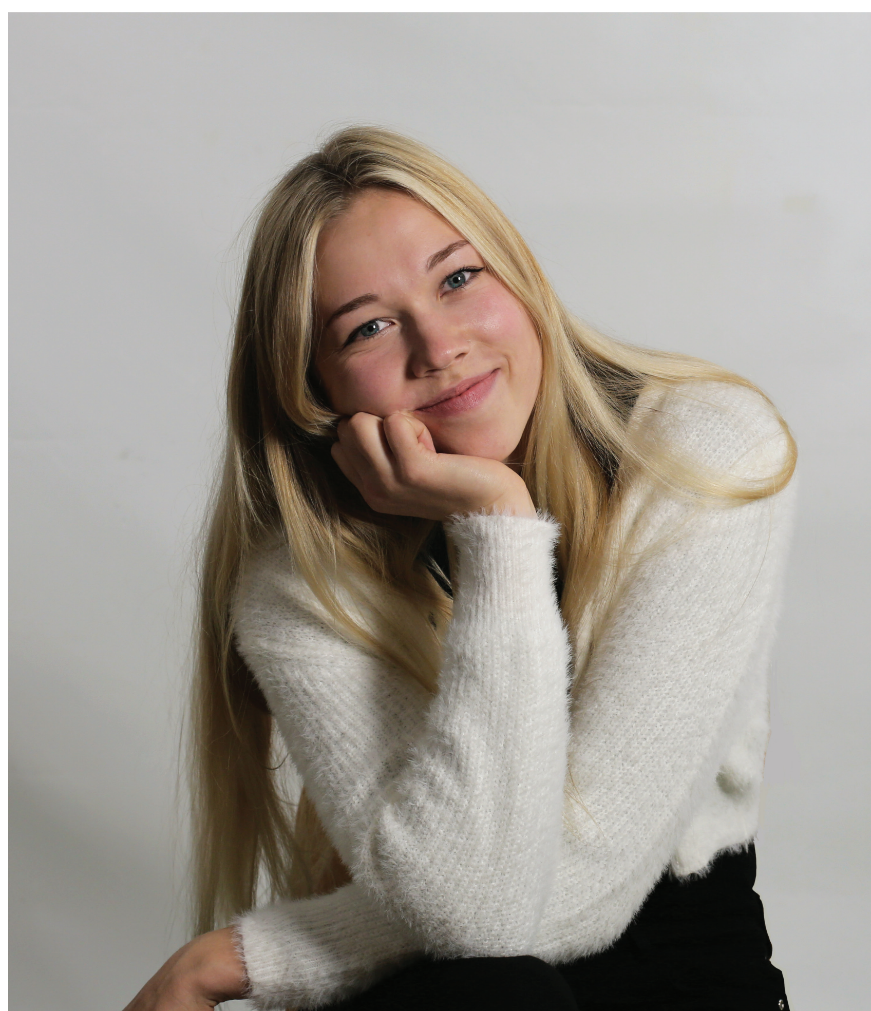
Töö autor.

Võru maakonnas asuv Rõuge vald moodustus oma praegusel kujul haldusreformiga 2017. aastal, kui ühendati Mõniste, Varstu, Haanja, Misso ja Rõuge vald. Pärast ühinemist kerkis esile küsimus ühendvalla visuaalsest identiteedist.