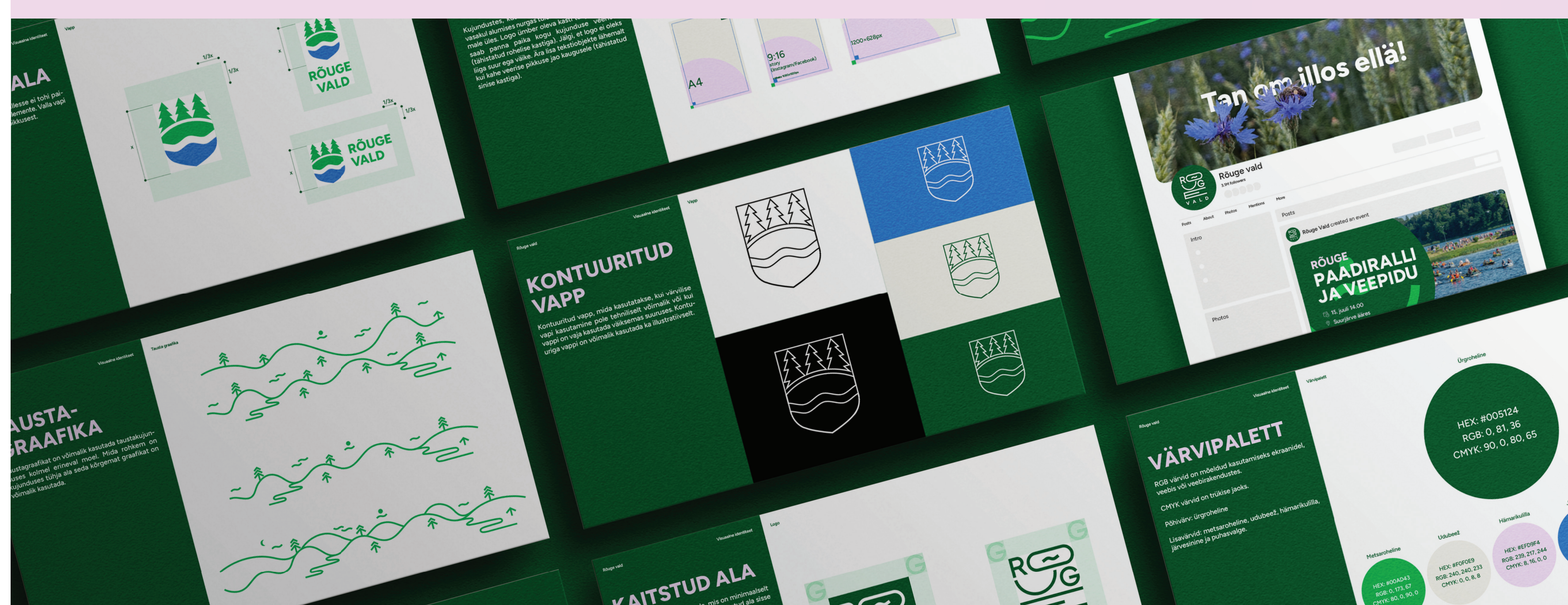
Pildid Rõuge valla stiiliraamatust.