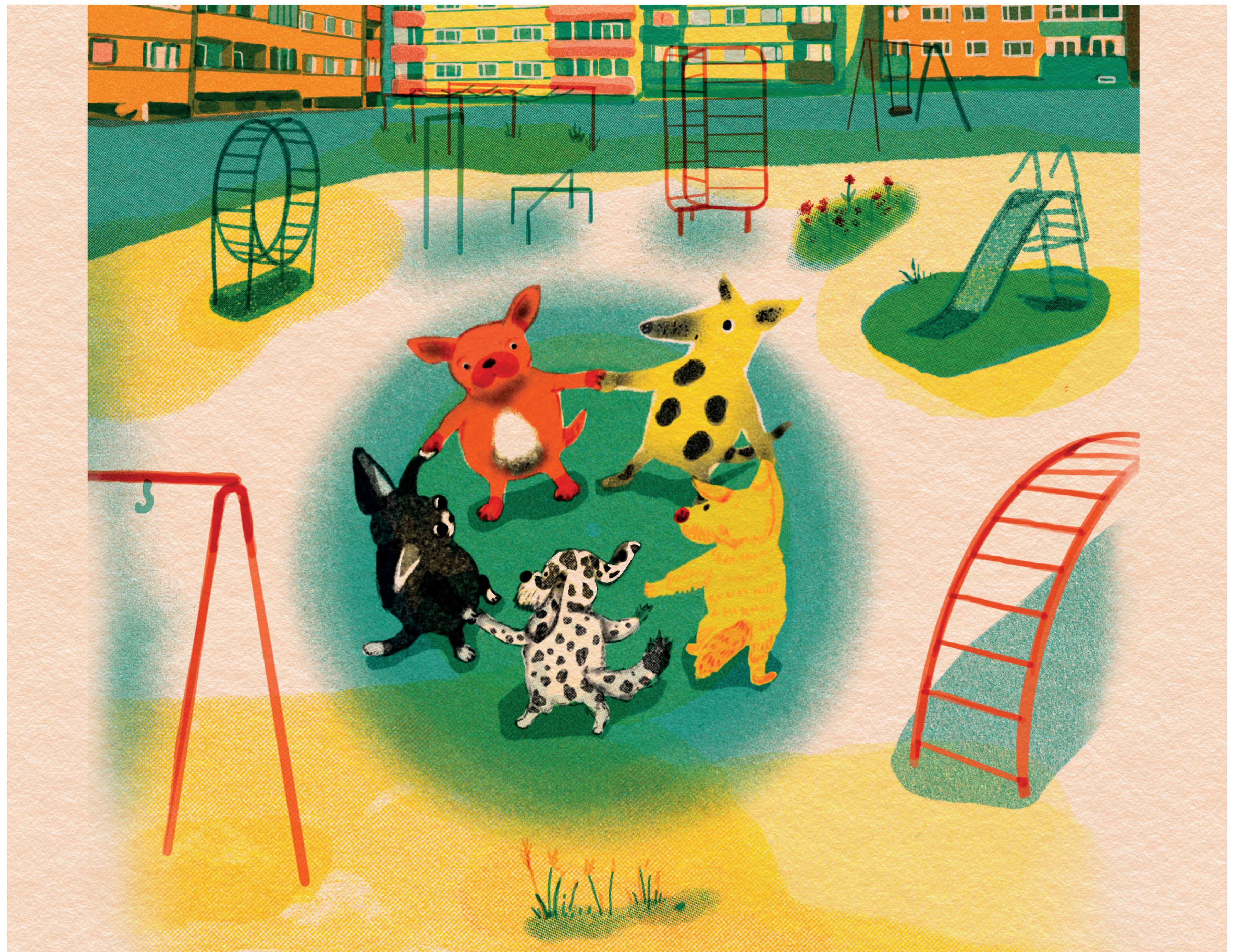
Knopka ja sõbrad. Illustratsiooni autor: Alicia Jemets

„Knopka dogtriin“ on seitsmest illustratsioonist koosnev sari, mis põhineb autori loodud fiktsioonil. Töö eesmärk oli kujundada tegelane Knopka – koer, kes on suuteline tegutsema inimesele omasel moel. „Knopka dogtriin“ tuleneb peategelase nimest ning sõnadest „doktriin“ ja „dog“ (ee koer).