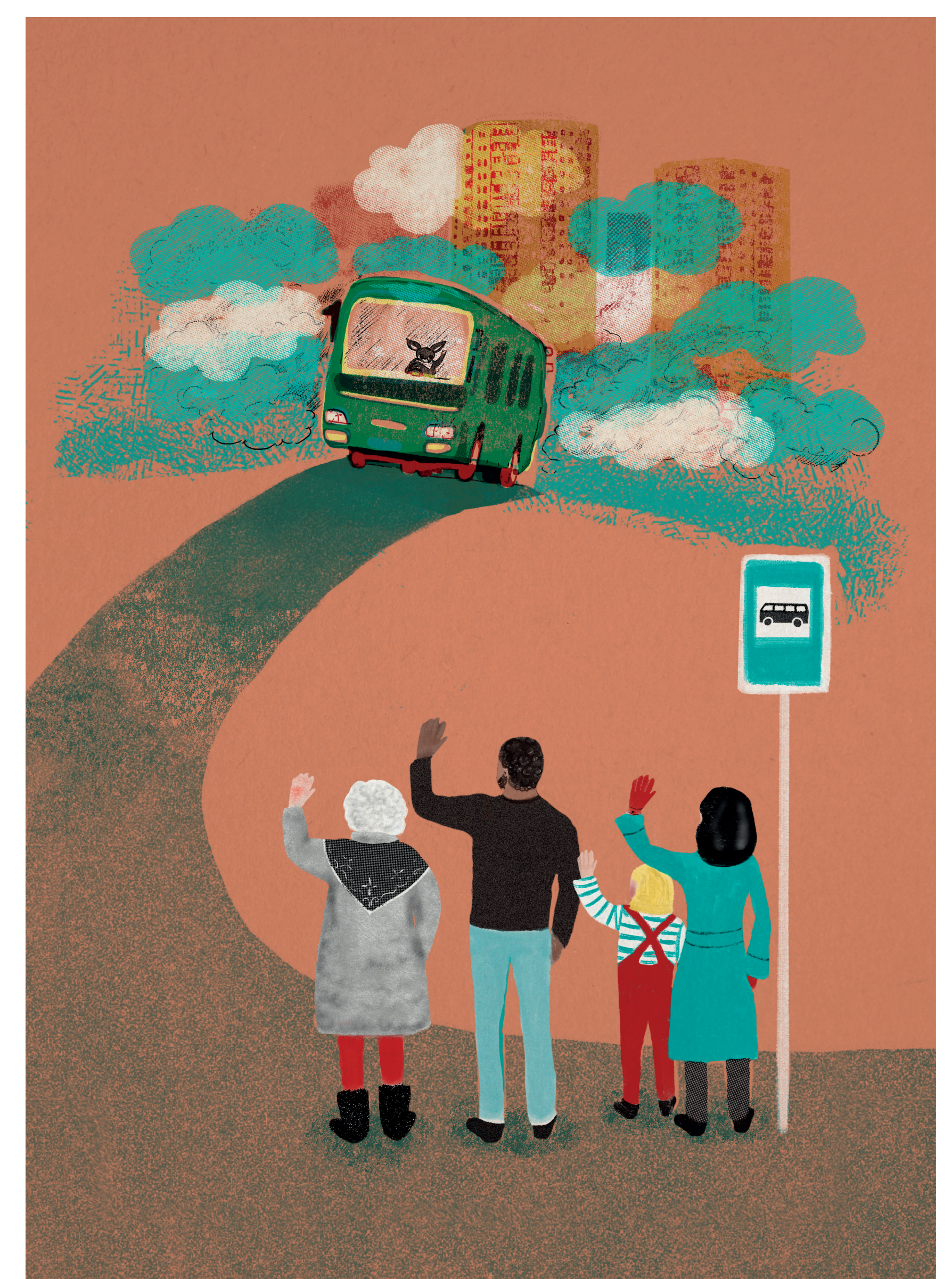
Sekeldused Knopka elus. Illustratsiooni autor: Alicia Jemets