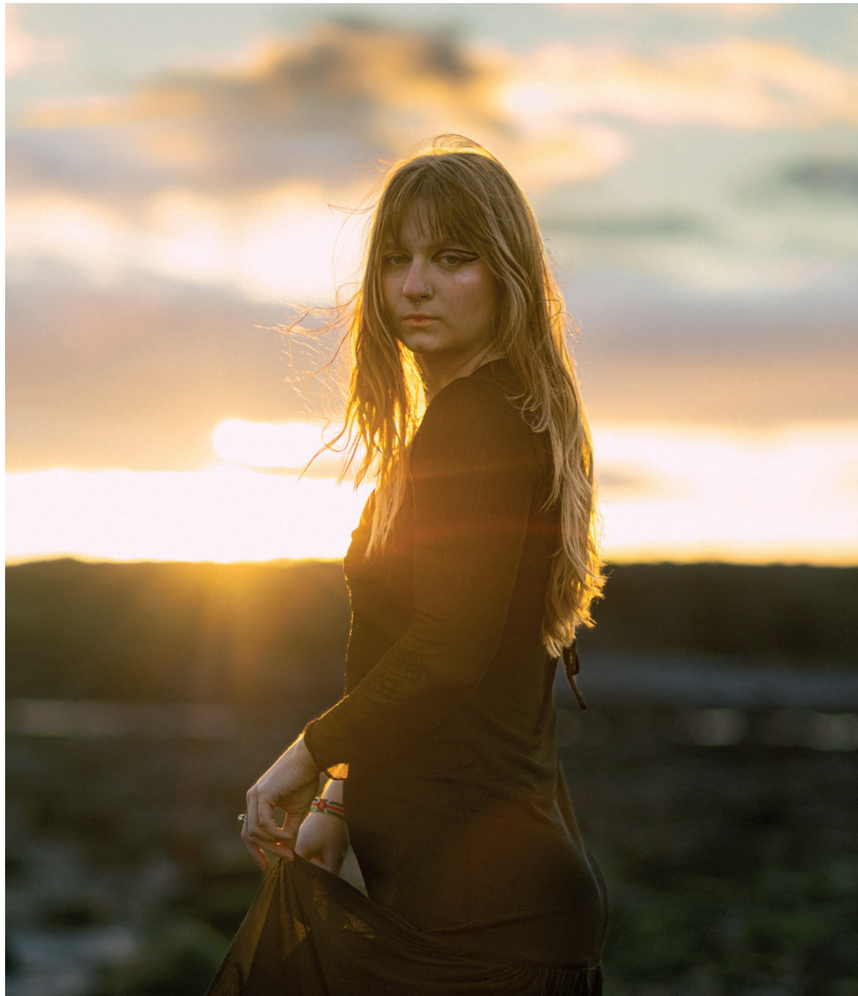
Töö autor.