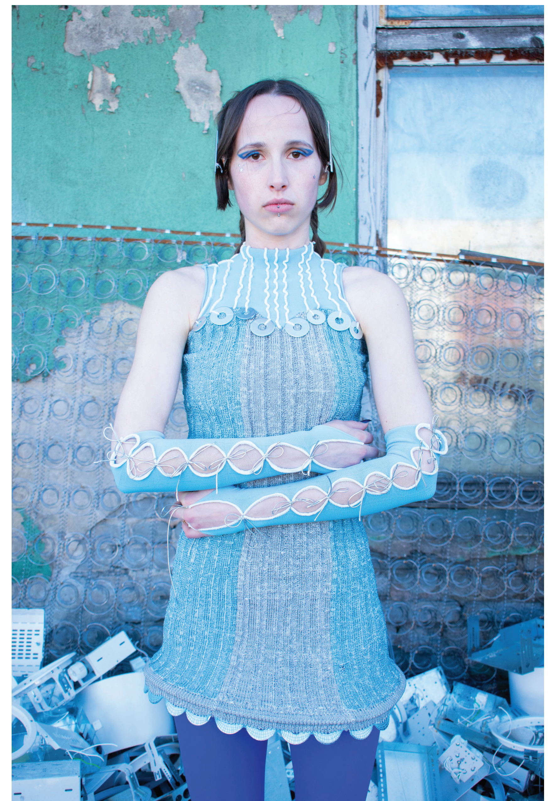
ZIGZA kleit, alumise ääre vormi moodustavad seibid ja kokku keevitatud metalltraadist ring