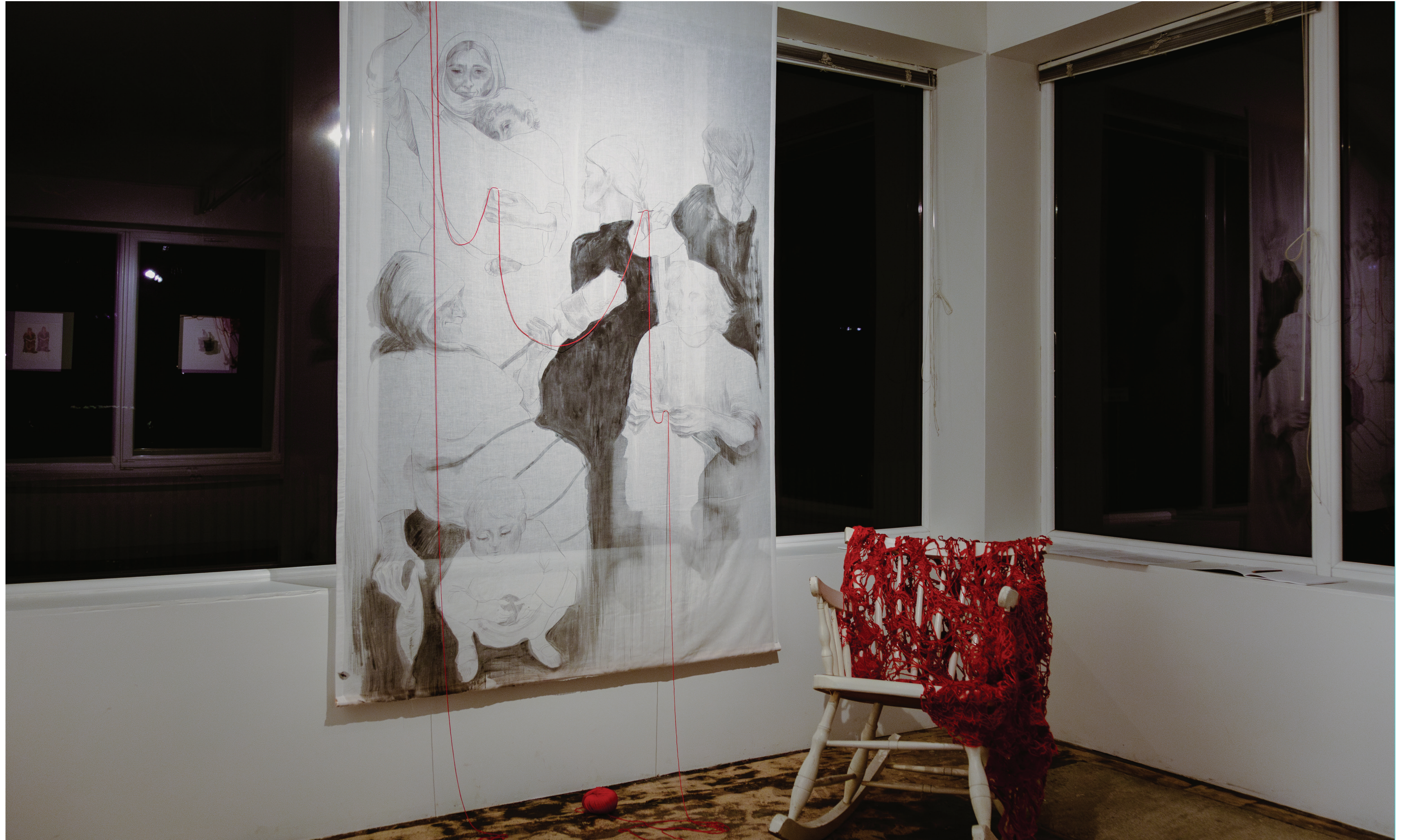
“Ajakanga kudumine”, foto autor Markus Kliss.

Lõputöö praktiliseks tulemuseks on kaks kuud kestev graafikanäitus „KERA”, mis on inspireeritud Gruusias veedetud praktikast. Näitusel on eksponeeritud 12 graafilist teost ja kaks tekstiilteost ning valik trükiplaate, mis kõik annavad edasi teises riigis kogetud emotsioone, nähtut ja mõtisklusi identiteedi ja inimeseks olemise teemal.