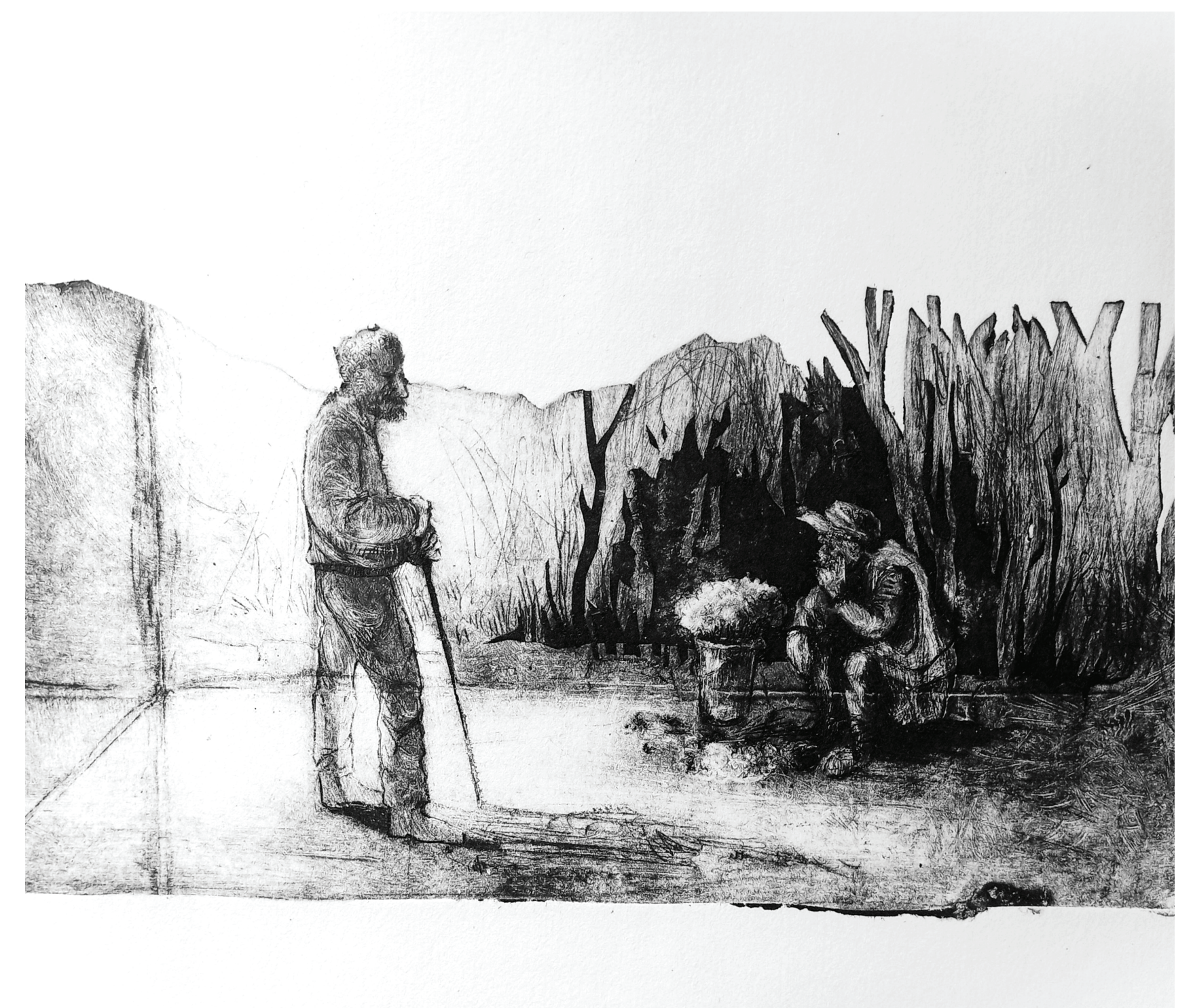
“Karikakramüüja”, autori foto.

The practical outcome of the thesis is a two-month-long graphic exhibition titled “KERA,” inspired by my internship in Georgia. The exhibition features 12 graphic works, two textile works, and a selection of printing plates, all conveying emotions, observations, and reflections on identity and being human experienced in another country.