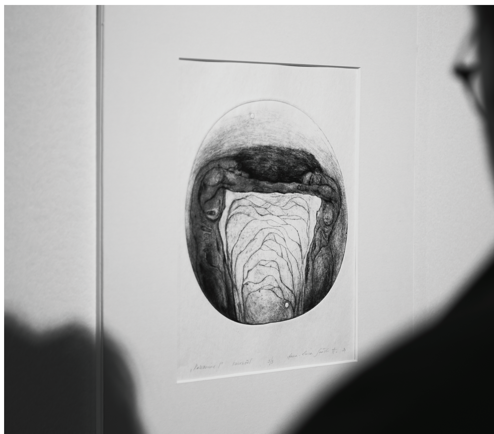
“Kasvamine I”.

Uurimuslik osa annab ülevaate Gruusia ja Eesti suhetest ning minu praktikakogemusest teises inspireerivas kultuuriruumis. Töö uurib seoseid kahe väikese rahva vahel ning mõtiskleb identiteedi erinevuste ja sarnasuste üle, millest inspireerituna sündisid ka näituse kontseptsioon ning algne idee.