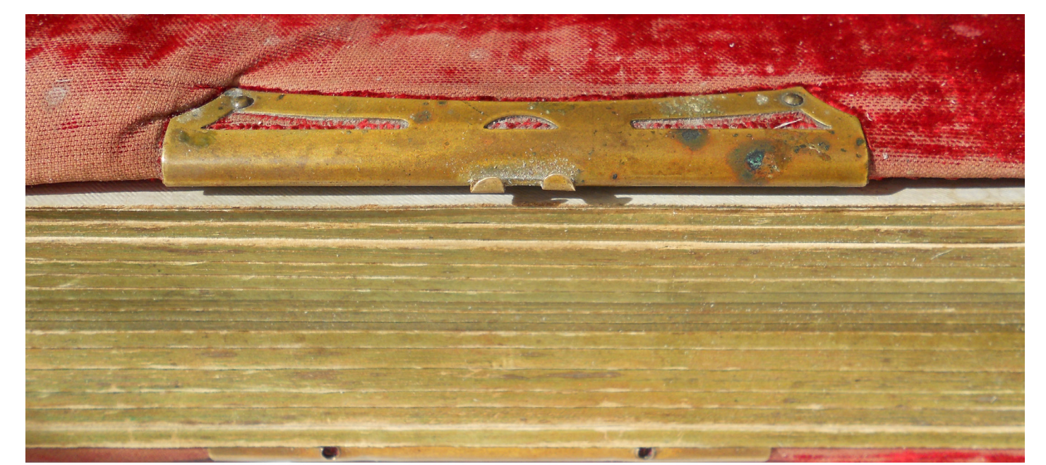
Osaliselt säilinud sulgur ja taastatud sulgurhaak.-