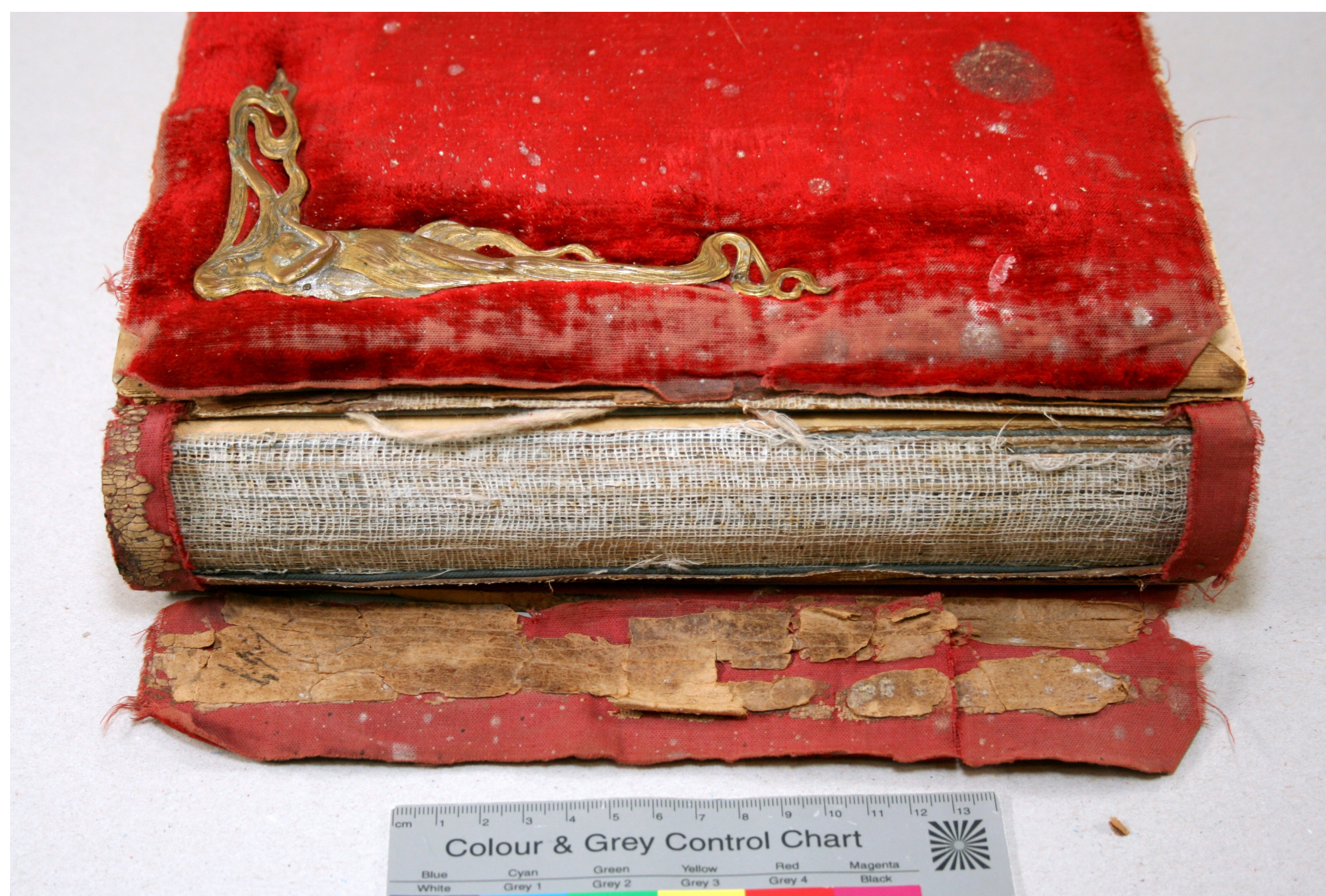
Fotoalbumi seljaosa enne ja pärast konserveerimist.