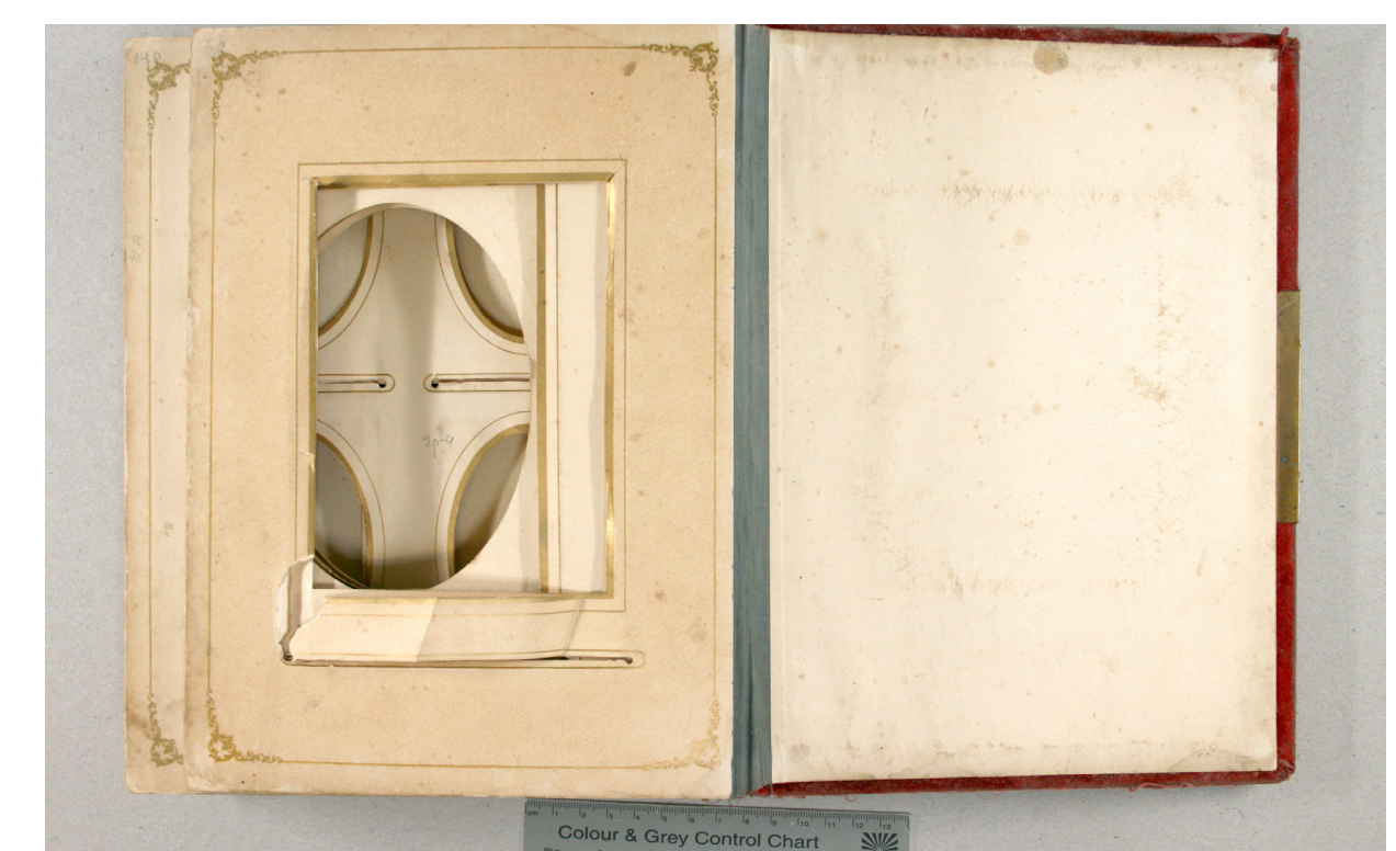
Rebenenud ning paigatud sisuleht.