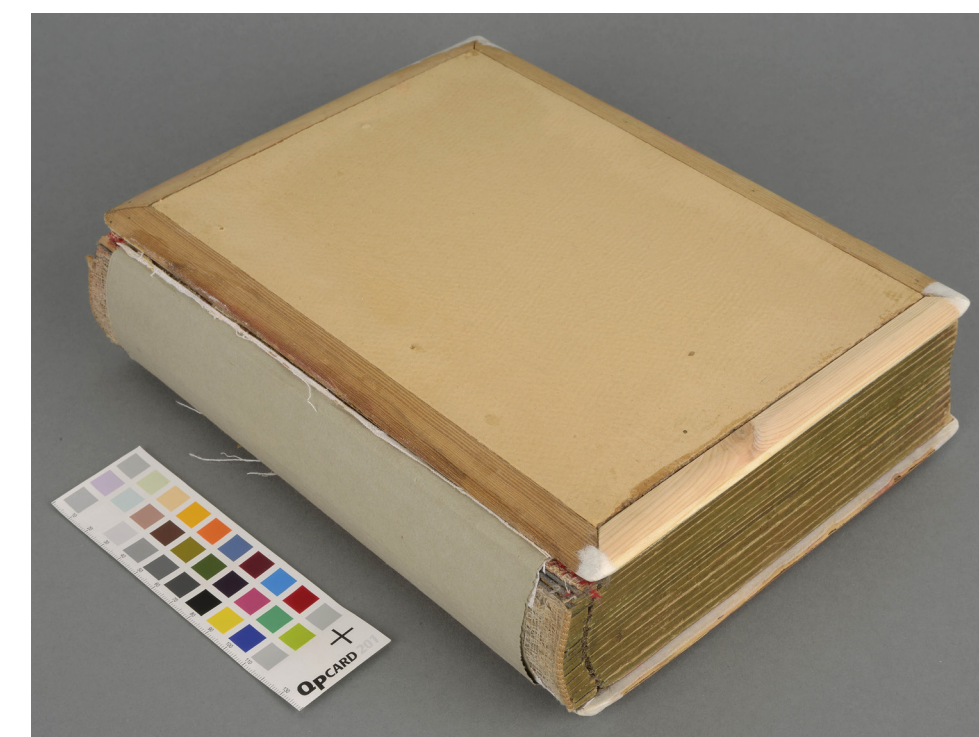
4. Fotoalbum pärast kaanematerjali eemaldamist ja korrastamist.