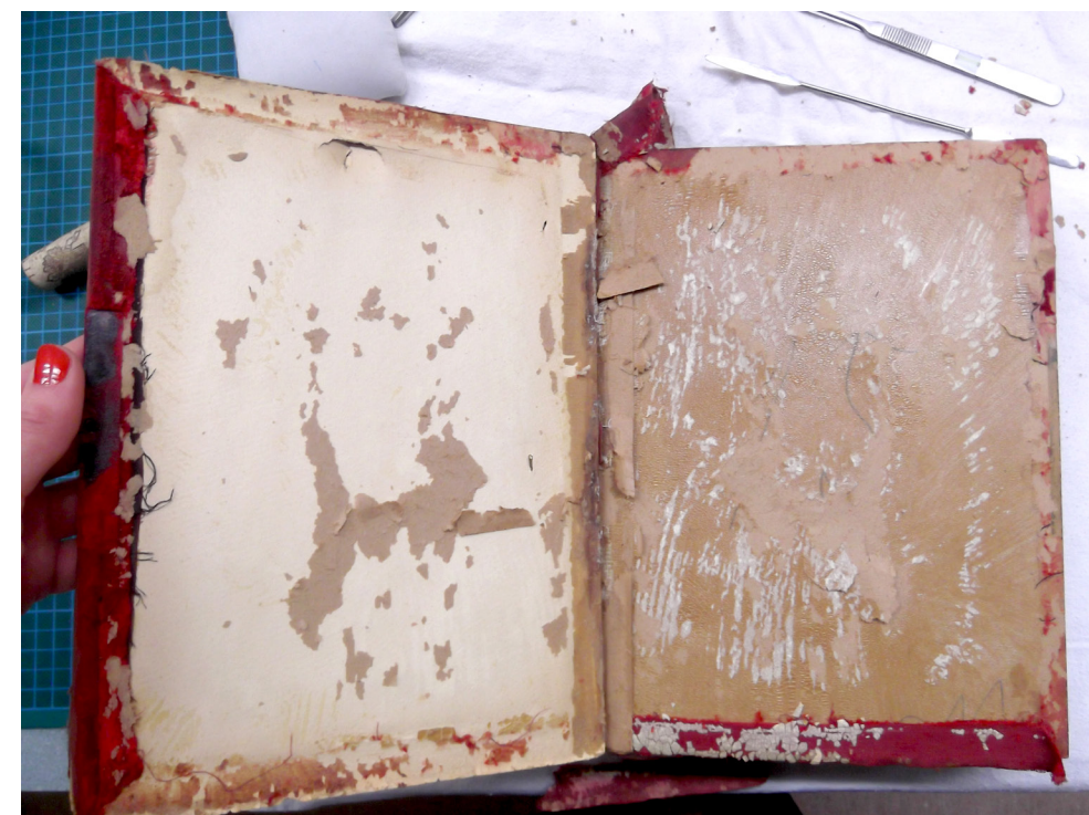
2. Kaante eemaldamine sisuplokist.