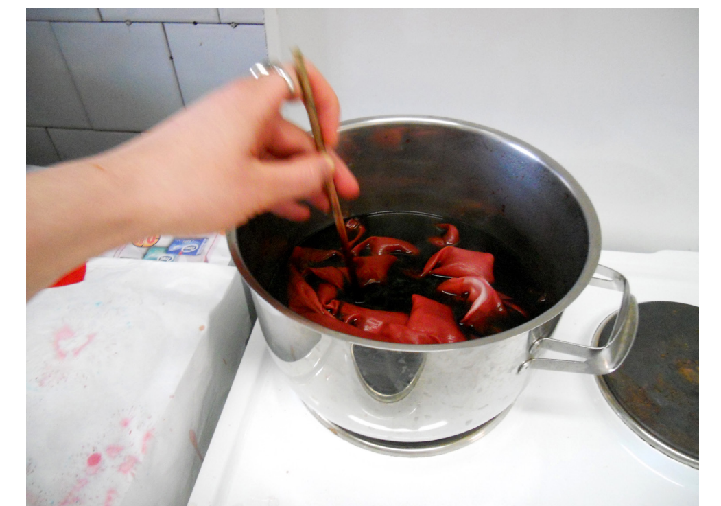
5. Siidkanga värvimine.