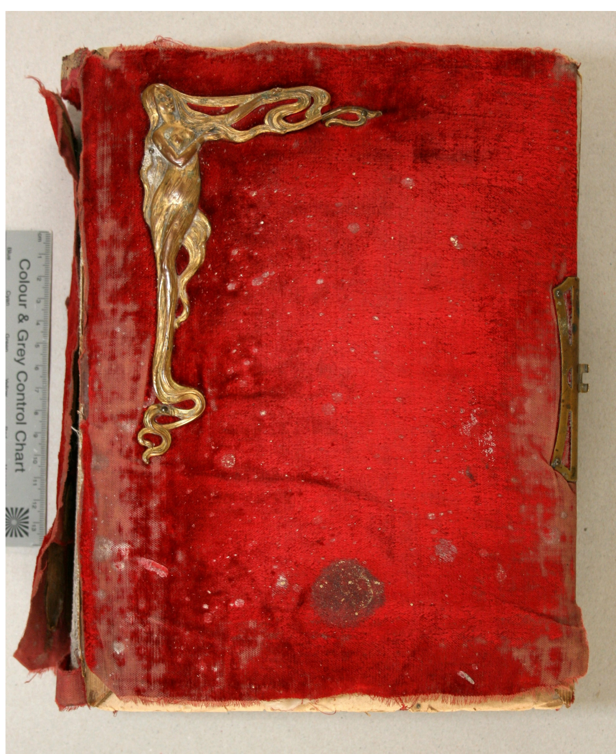
Fotoalbumi esikaas enne ja pärast konserveerimist.

Töö tulemusena on peatatud kahjustumisprotsessid ning foto-album on taas vaadeldav.