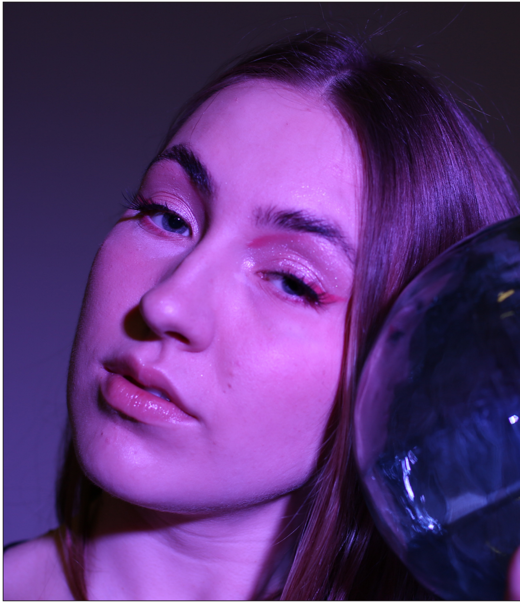
Fotol töö autor.

Käesoleva lõputöö keskmes on mikroettevõtte Atramic äriidee ning selle visuaalse identiteedi loomine. Plaanitav ettevõtte spetsialiseeruks graafilise disaini teenustele, mille põhirõhk on disainilahenduste pakkumine firmadele ja eraisikutele kas visuaalse identiteedi loomise või erinevate kujunduste näol.