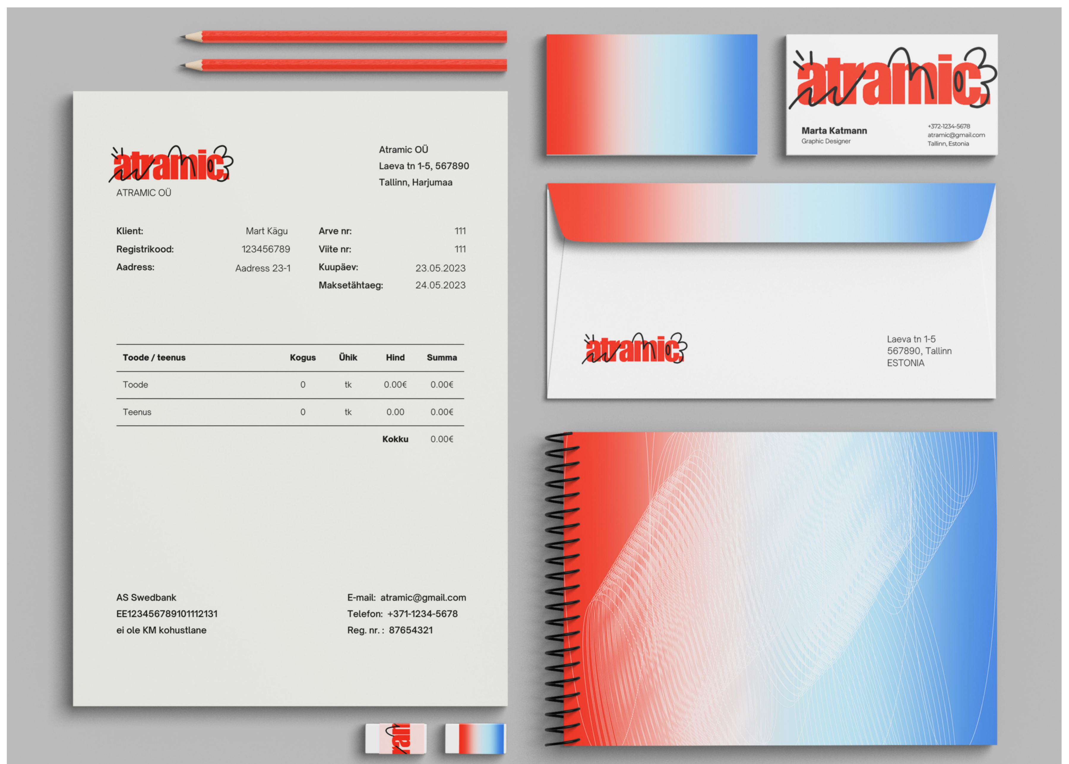
Atramic kontoritarvete komplekt