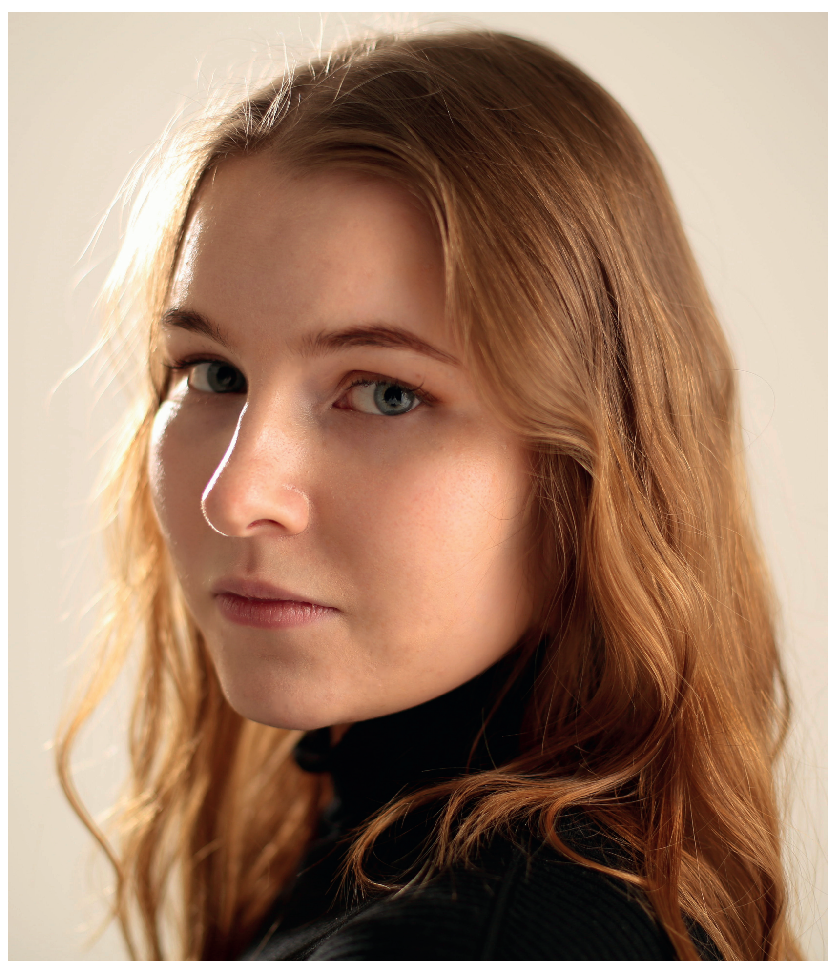
Fotol töö autor.

Juhendajad / Supervisors: LIIS TODESK, KRISTI LAANEMÄE