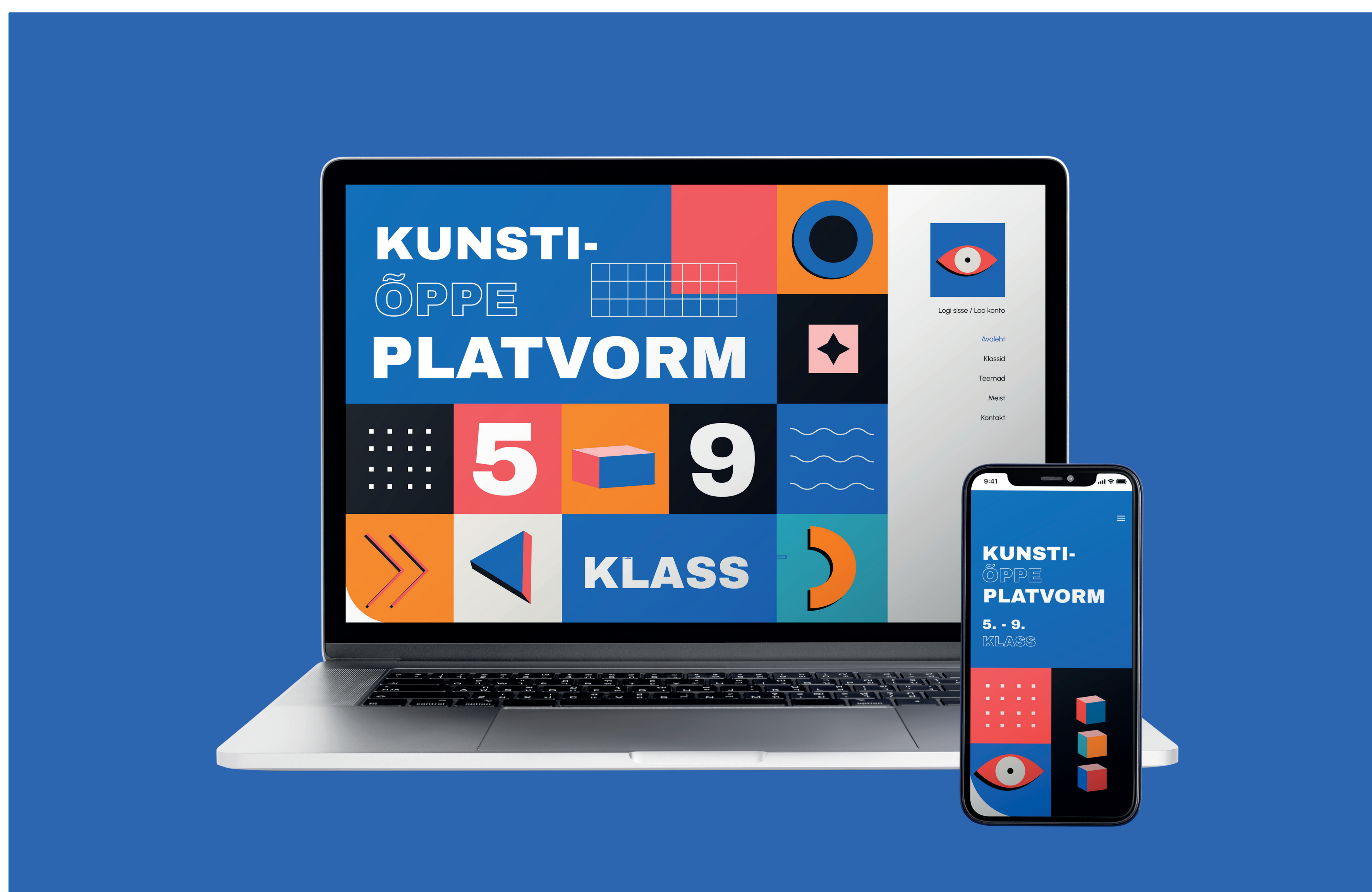
Kunstiõppe platvormi avaleht sülearvuti ja mobiili ekraanil. Maketi autor: Freepik

The art education platform created as the final project consists of a platform of art lesson topics and tasks, where art teachers can add and take lesson materials. The platform is intended for students in grades 5-9 and consists of various multimedia elements such as video, photo and text materials. The idea of the platform is to create a unified art educational medium in which teachers can get inspiration, support and feedback.