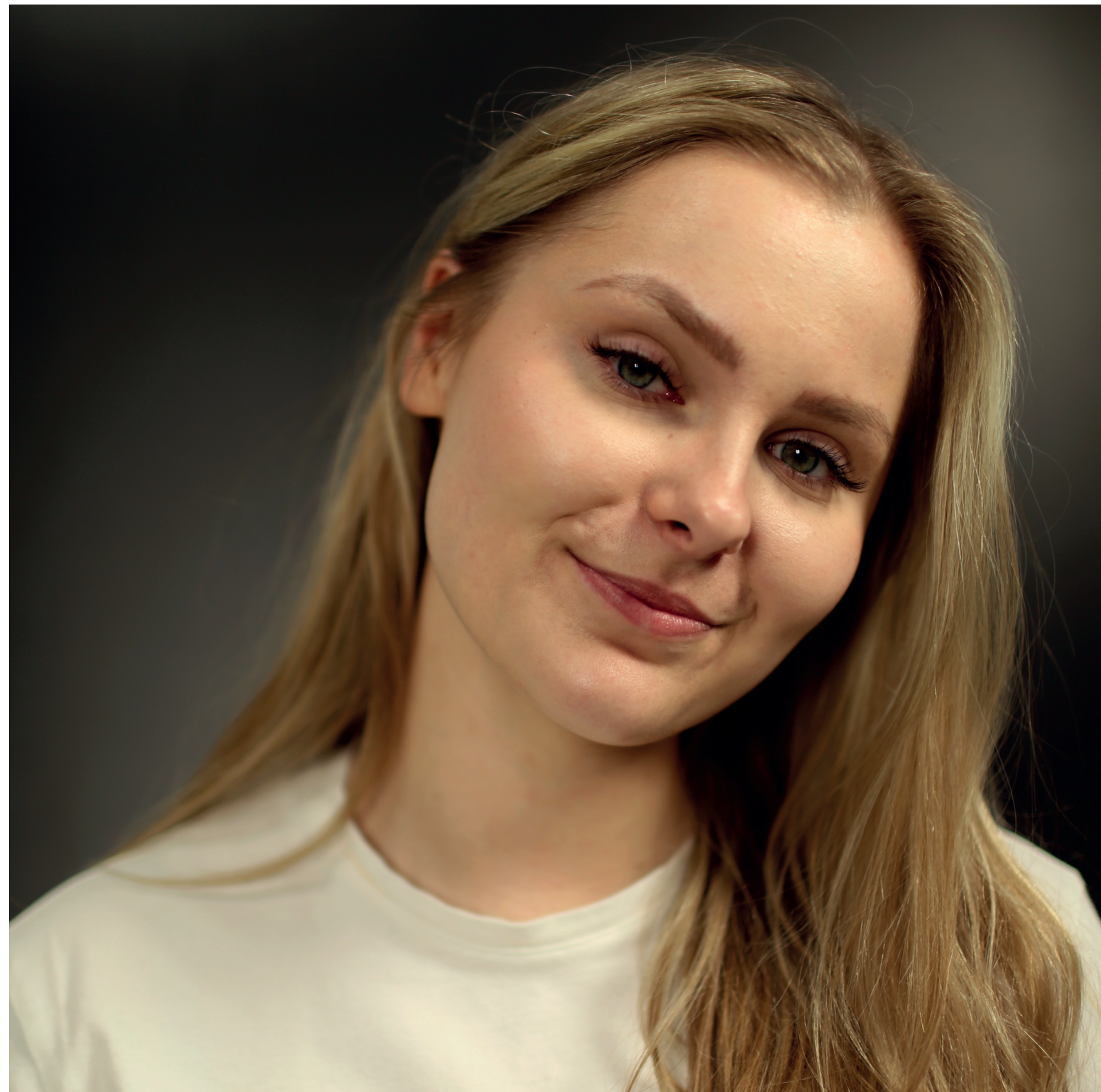
Autori portreefoto.

Oma lõputööna disainisin visuaalse identiteedi koduveini tootjale WILU. Tegu on perettevõttega, kelle tegevuse tulemusena valmib käsitööna kodumaine hõrk veinivalik.