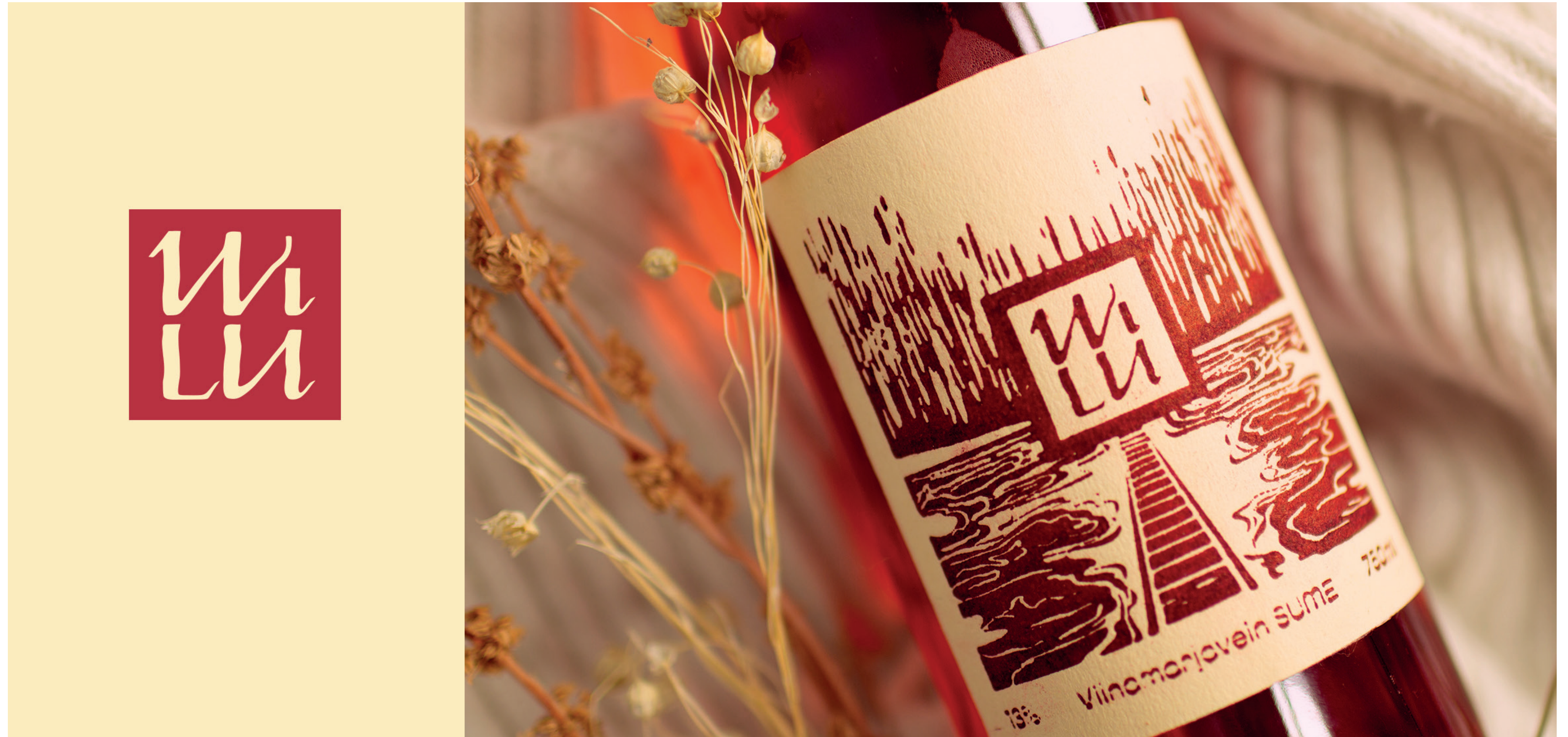
Valmis toode roosa viinamarjavein SUME.

For my final project, I created a visual identity for WILU, a domestic wine producer. It is a family business, who produce a delicious selection of crafted domestic wines.