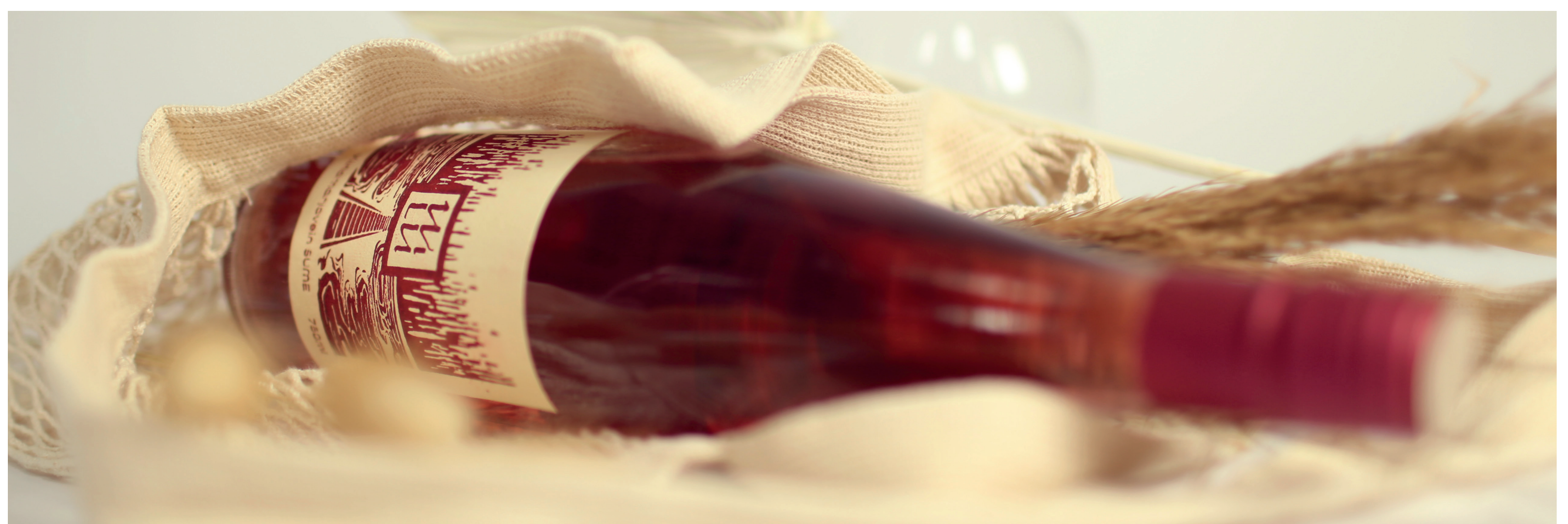
Tootefoto roosa viinamarjavein SUME.