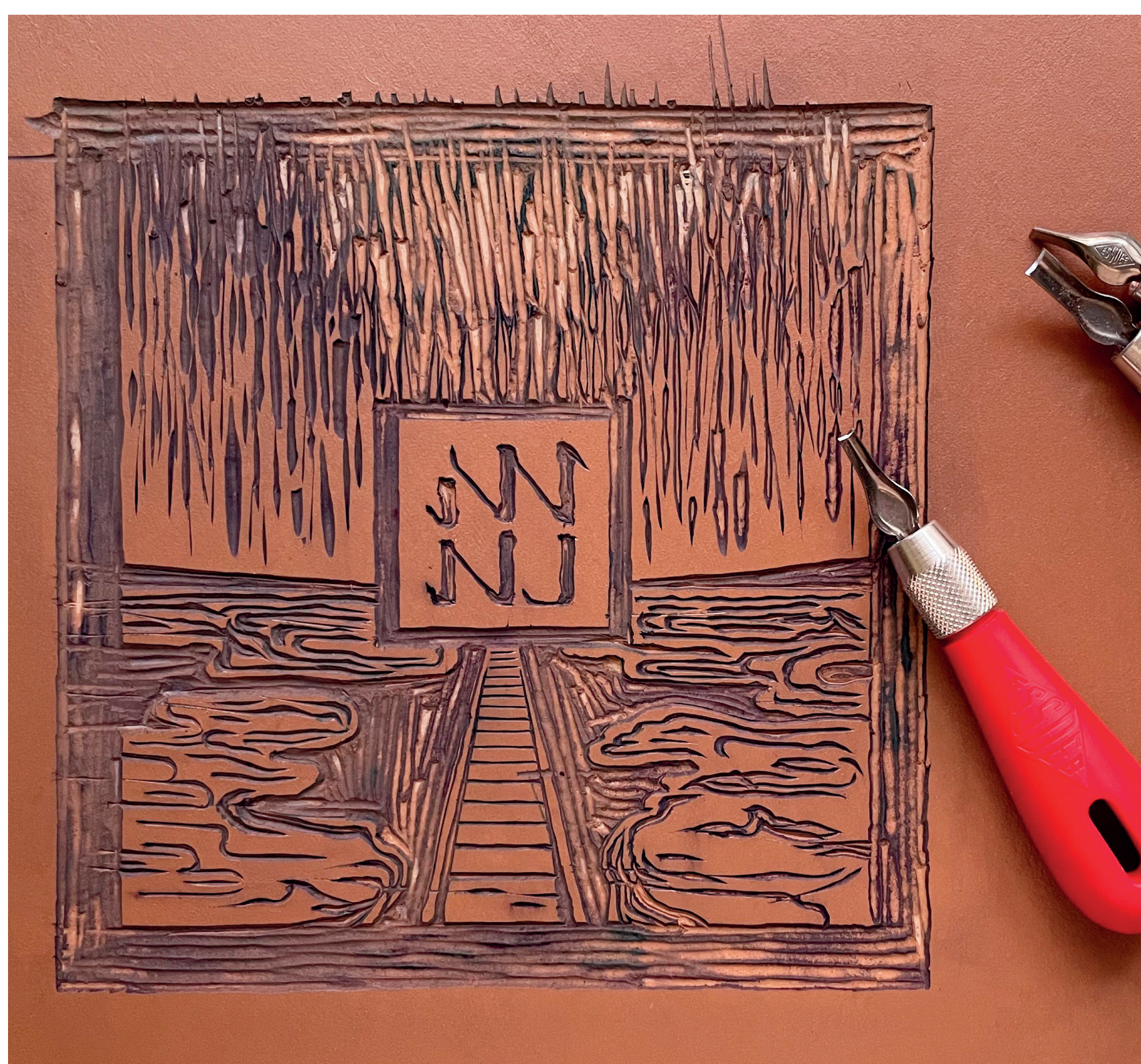
Linoollõikes illustratsioonist ja logost.

Lõputöö käigus valmis logo, etiketidisain veinile SUME, näidispudelid loodud etikettidega ning toote- ja meeleolufotod ning rakendused logo võimalikest kasutusviisidest. Sellega annan tootjale kõik vajalikud visuaalsed vahendid, et uue tootega turule tulla.