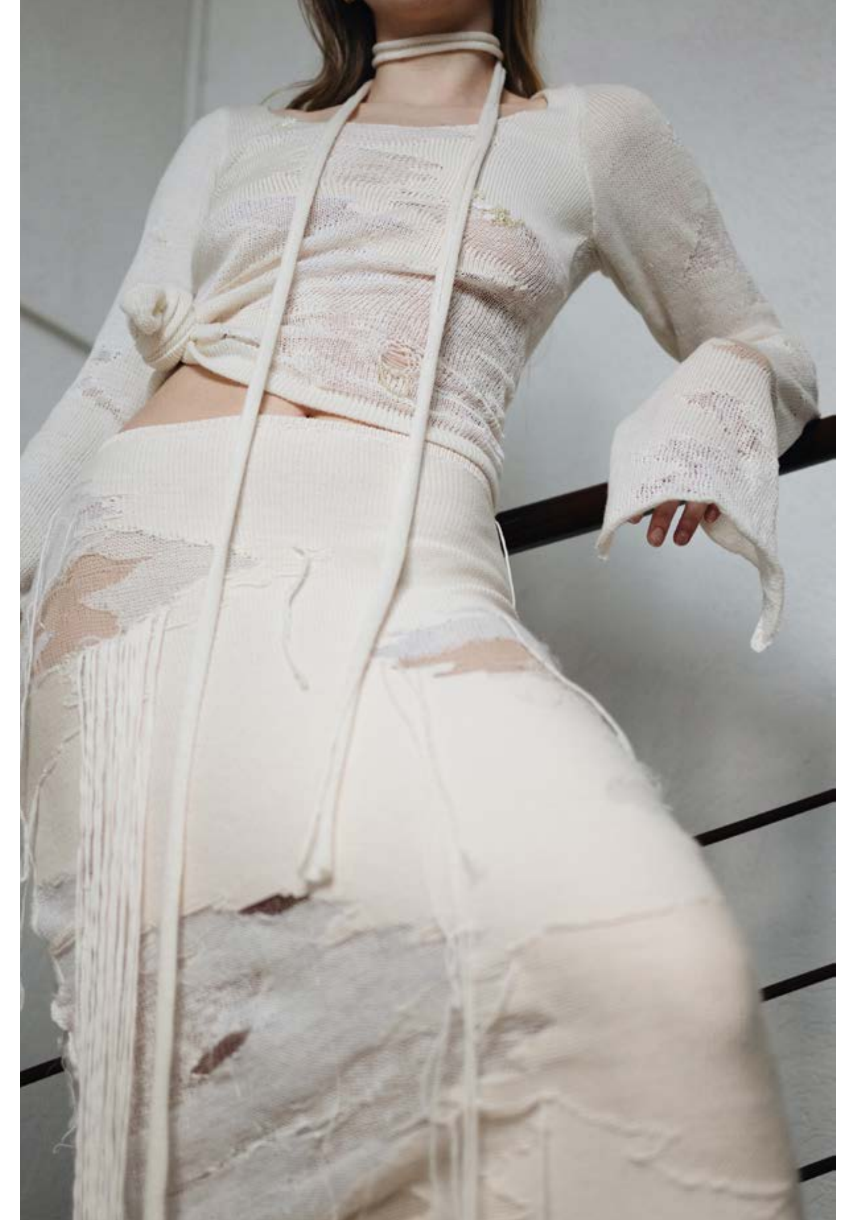
Silmuskudumimasinal intarsia kelguga kootud kudumi struktuur, kus omavahel on liidetud kuus erinevat valget tooni lõnga.