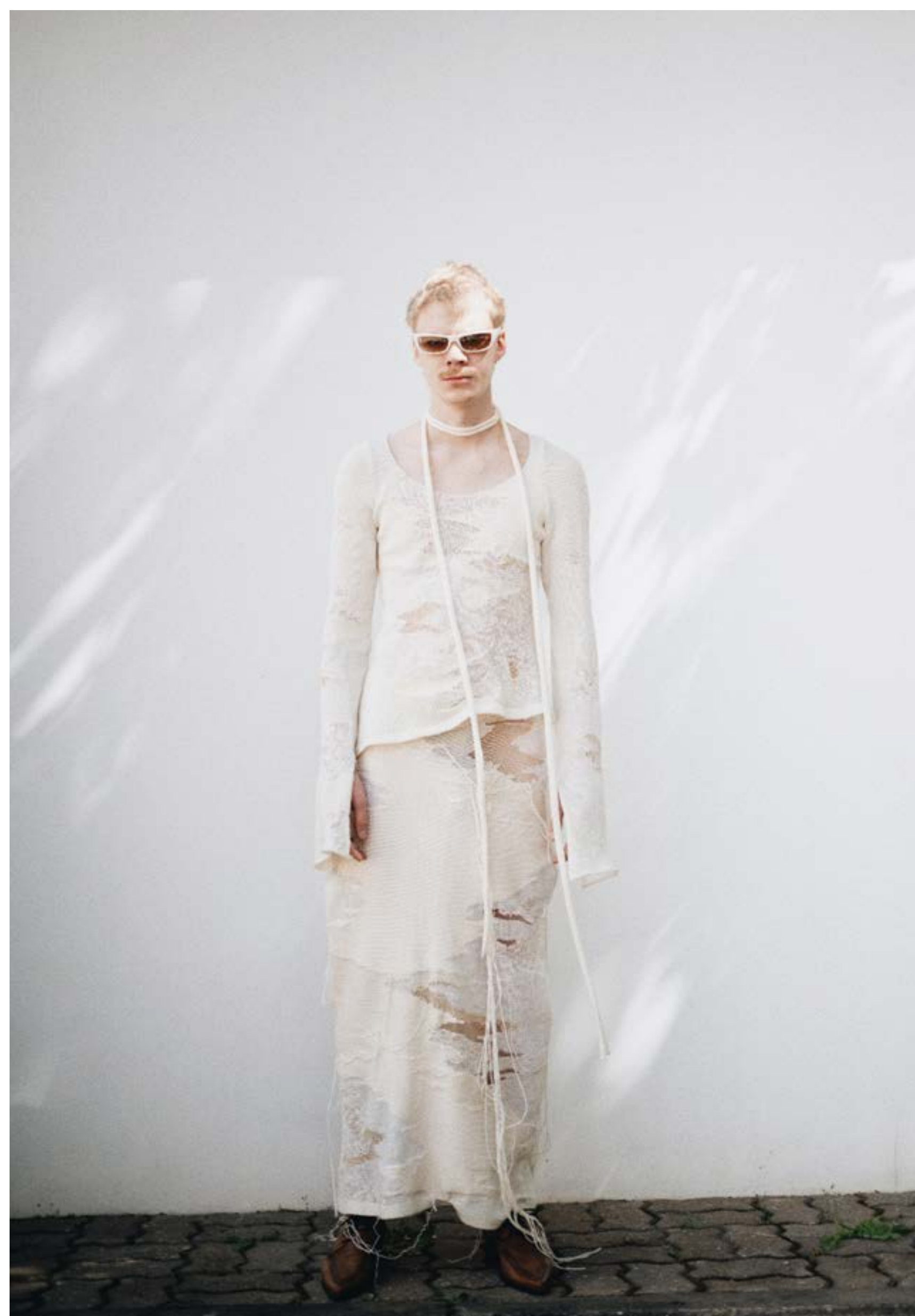
Kollektsiooni viienda komplekti üldvaade.