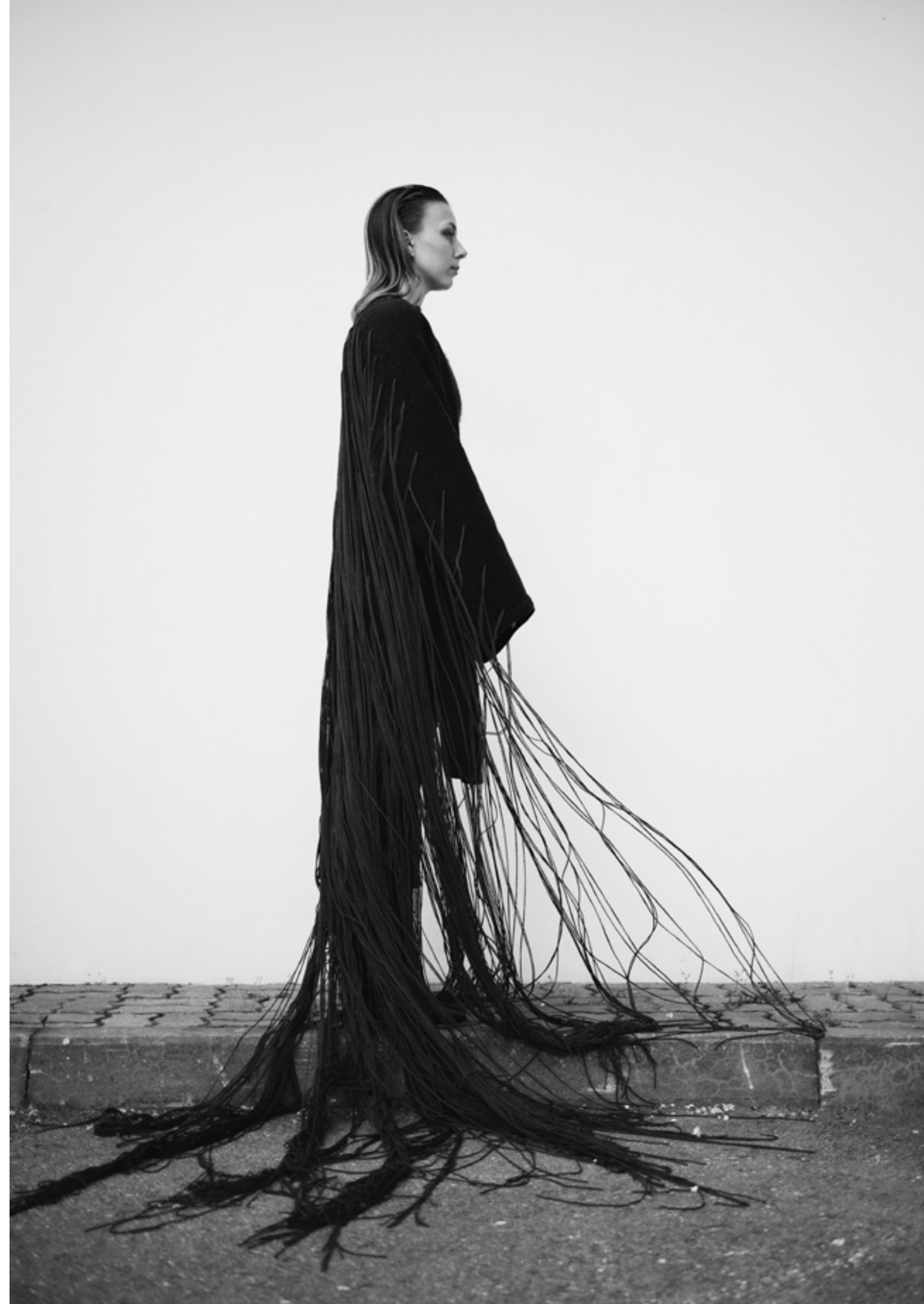
Kollektsiooni kolmas komplekt – Muhumaa lammaste villast kootud pikkade lõngajooksudega kampsun.

The experiments lead to the collection of knitwear "Tender Conversations" aimed for the runways, which toys with the balance of covered and exposed body. Its concept talks about depression and the fragile side of being human.