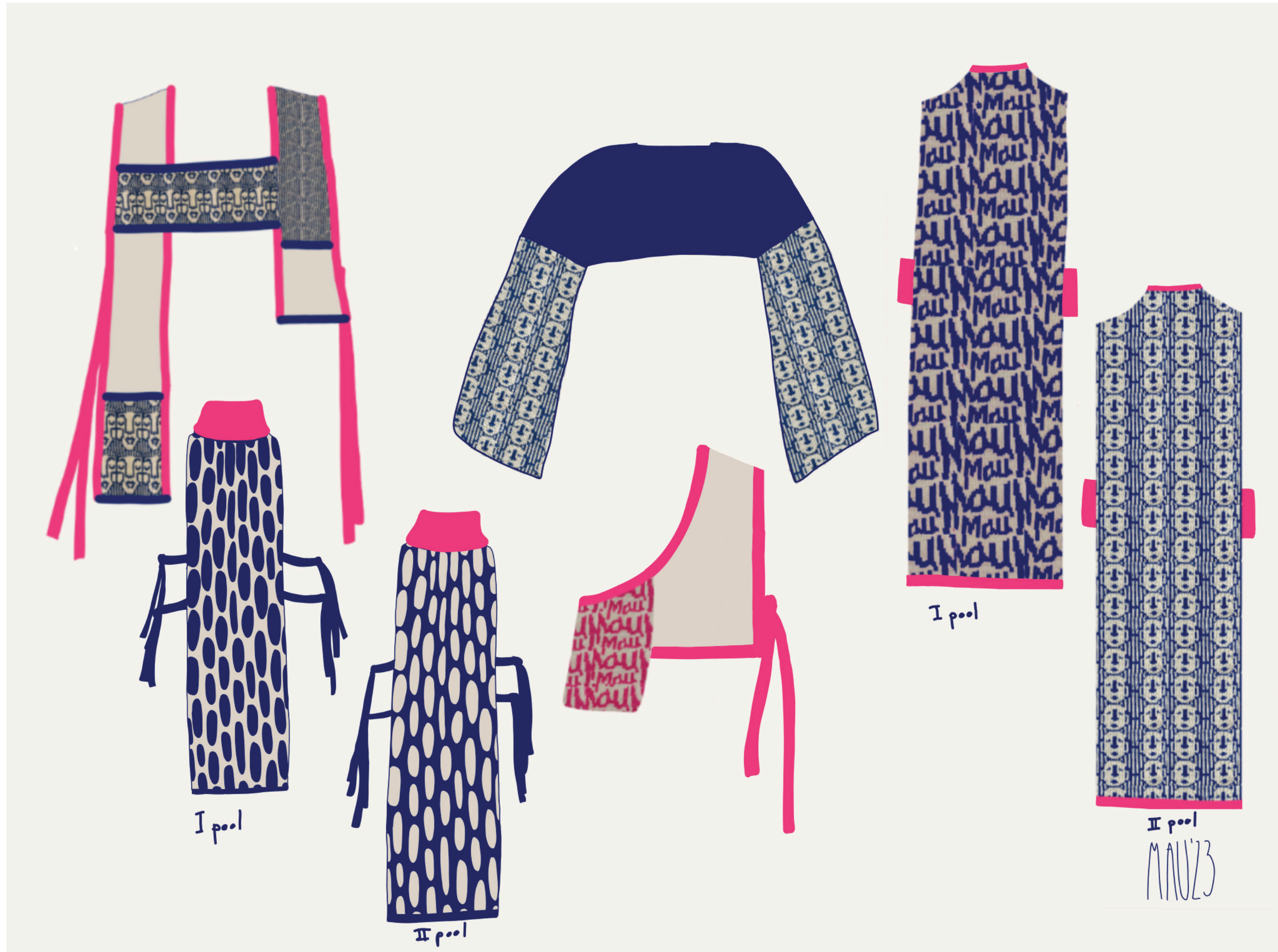
Viie moodulkudumi kavandid

Sageli tüdinetakse samade rõivaste kandmisest kiiresti ning tarbimiskultuuri tempo viib tihti uute riiete ostuni. Minu lõputöö eesmärk on leida viis, kuidas aeglustada rõivastest tüdimist, pakkudes alternatiiviks moodulkudumid, millega saab riietusele anda esteetilist ja praktilist väärtust. Kudumitega on võimalik lisada näiteks taskuid, pikemaid varrukaid, kõrgemat kraed või soojemat kehaosa.