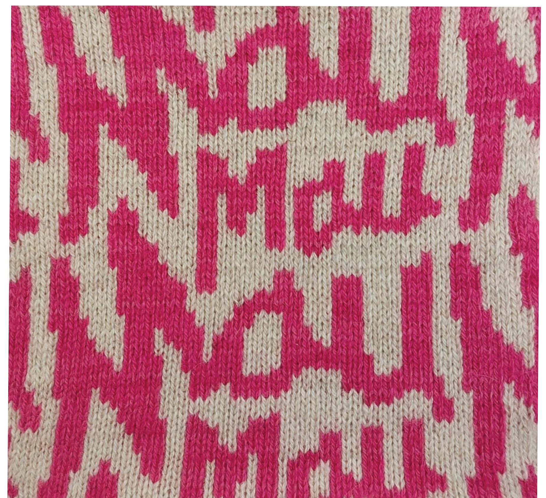
Kudumimuster "Mau"