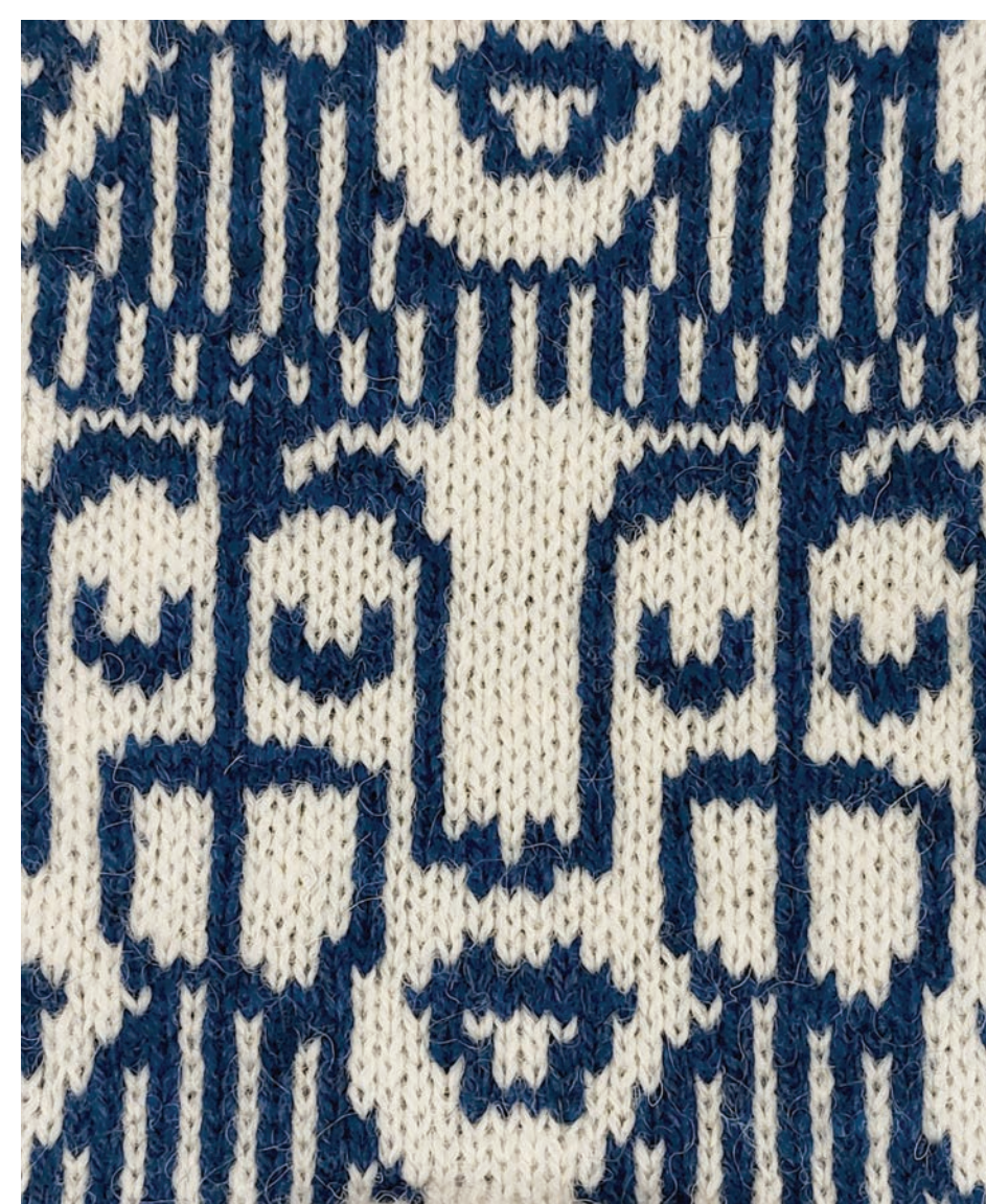
Kudumimuster "Omanäod 2"

People often tire of wearing the same garments, and the pace of consumer culture often leads to the purchase of new clothes. The goal of my final project is to find a way to slow down this process by offering an alternative of modular knitwear, which can be used to add aesthetic and practical value to clothing. With these knits, it is possible to add pockets, longer sleeves, a higher collar or a warmer bodice.