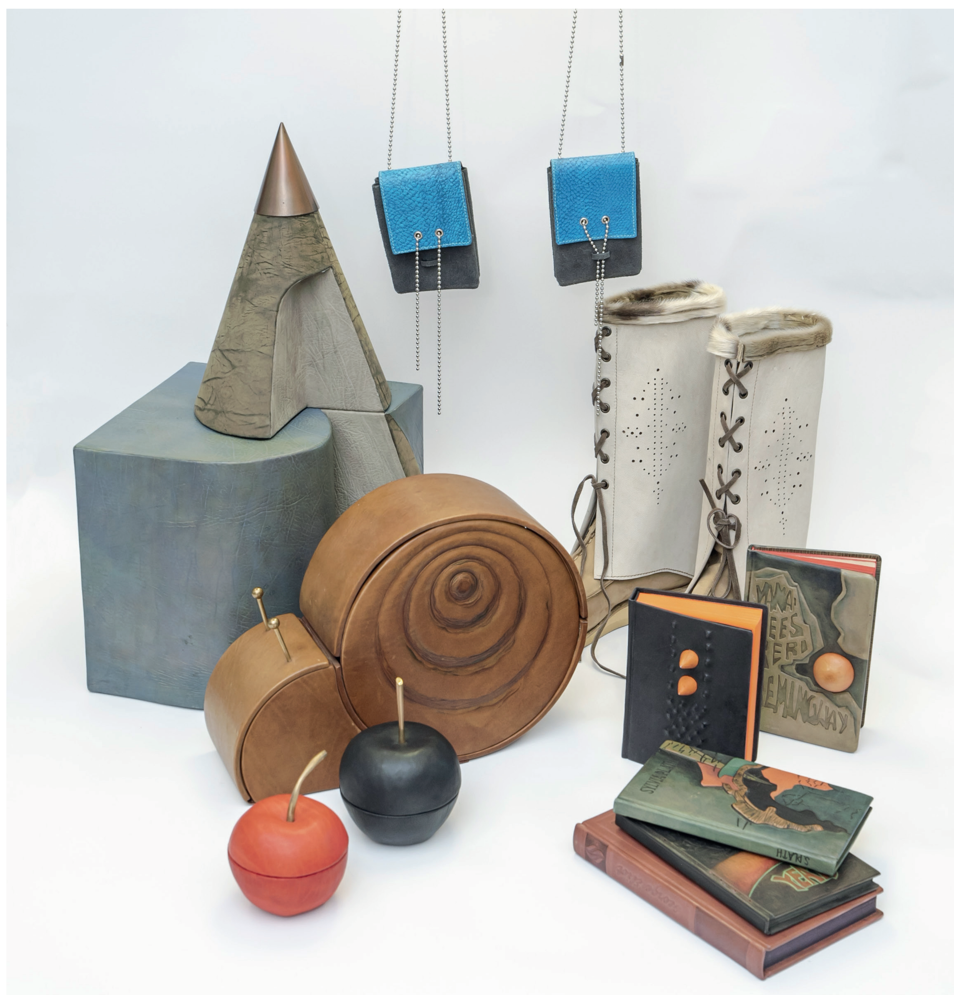
Esemed metoodilises fondis

In the course of the thesis, one will get an overview of the objects belonging to the collection of the leather design department of the Pallas University of Applied Sciences and their condition.