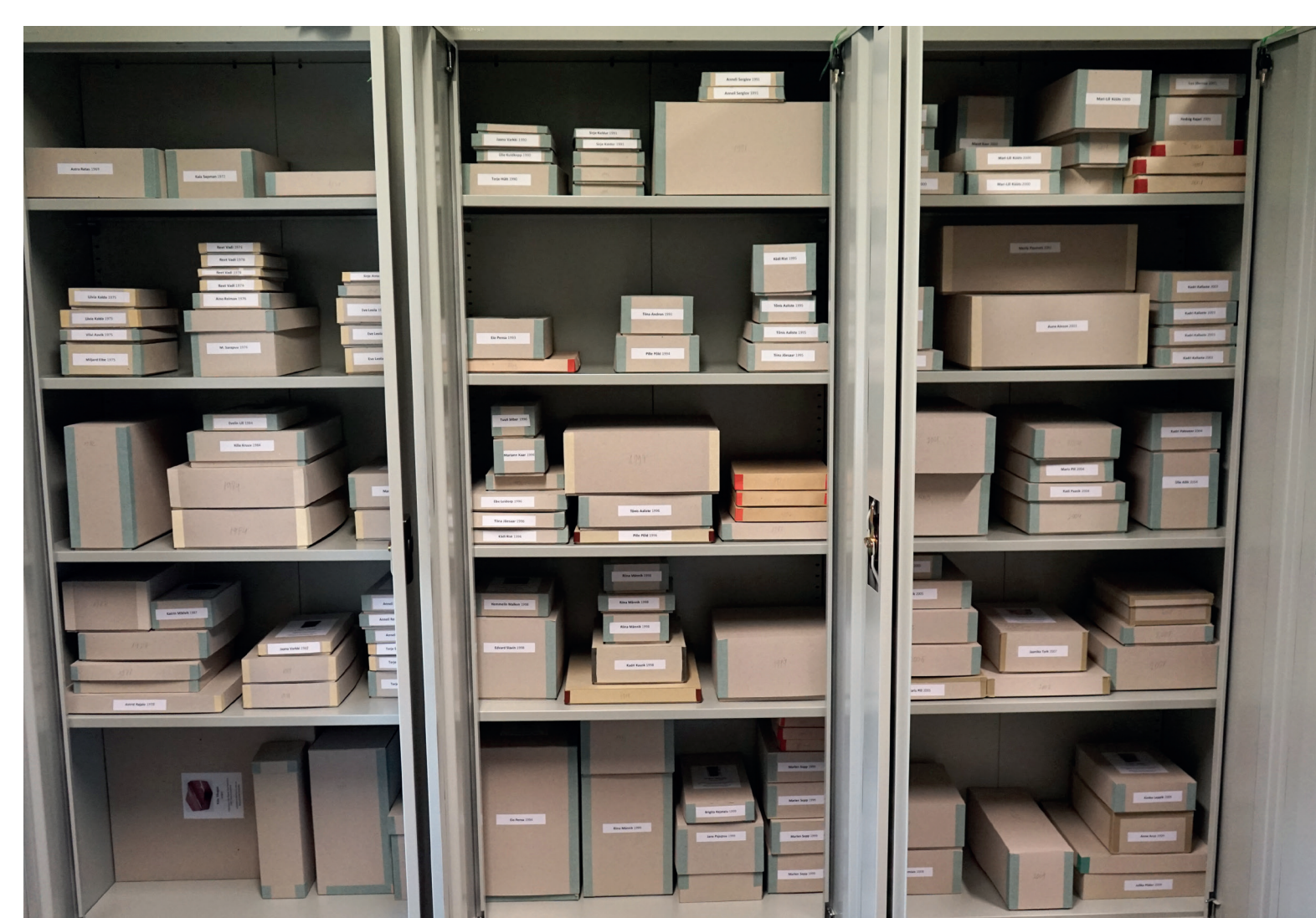
Arhiivikapi vaade