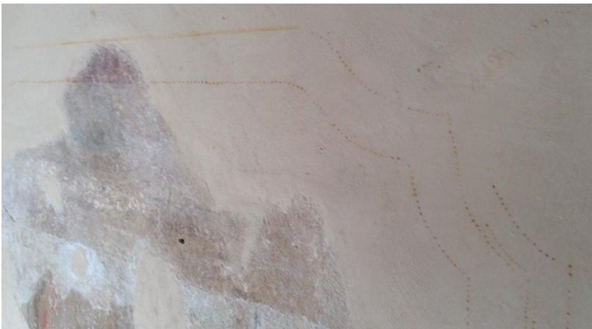
Foto 11 Fragment maalingust enne retušeerimist