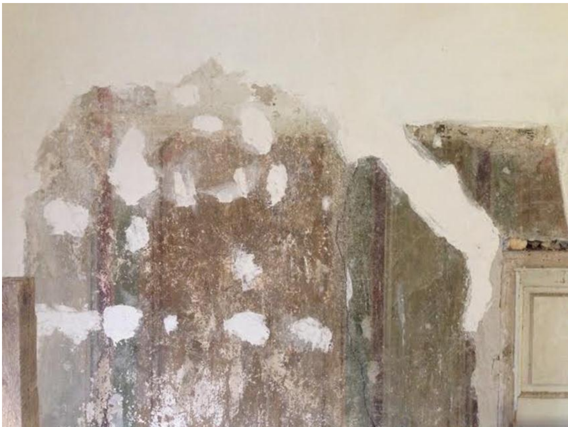
Foto 9 Maalingu alumise osa peale parandusi