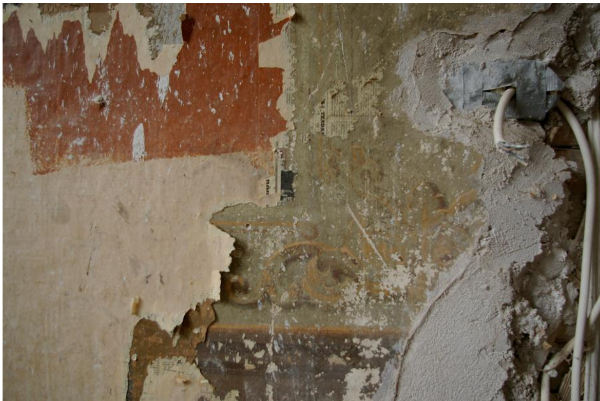
Foto 2-3 Hiljem kruvidega kinnitatud pragu enne parandusi