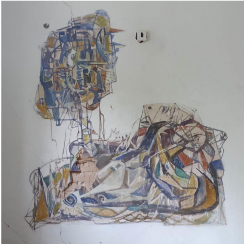
Foto 4 . Seinamaaling ja selle kahjustused enne konserveerimistöid