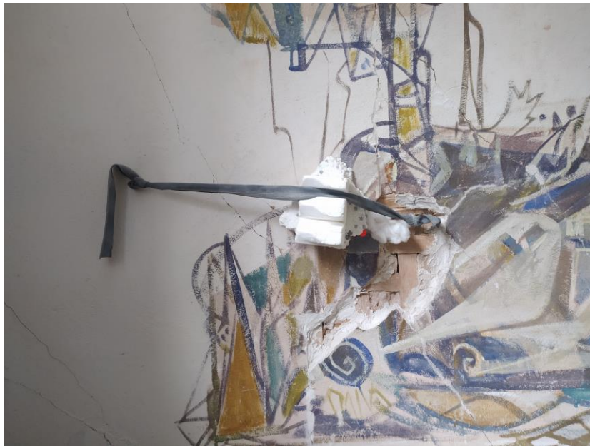
Foto5 . Seinaga toetamine peale injekteerimist.