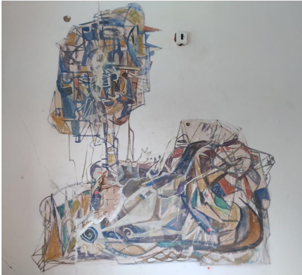
Foto 6. Seinamaaling peale konserveerimistöid.

8. Teostatud tööde tulemus: Konserveeritud objekt on stabiliseeritud.