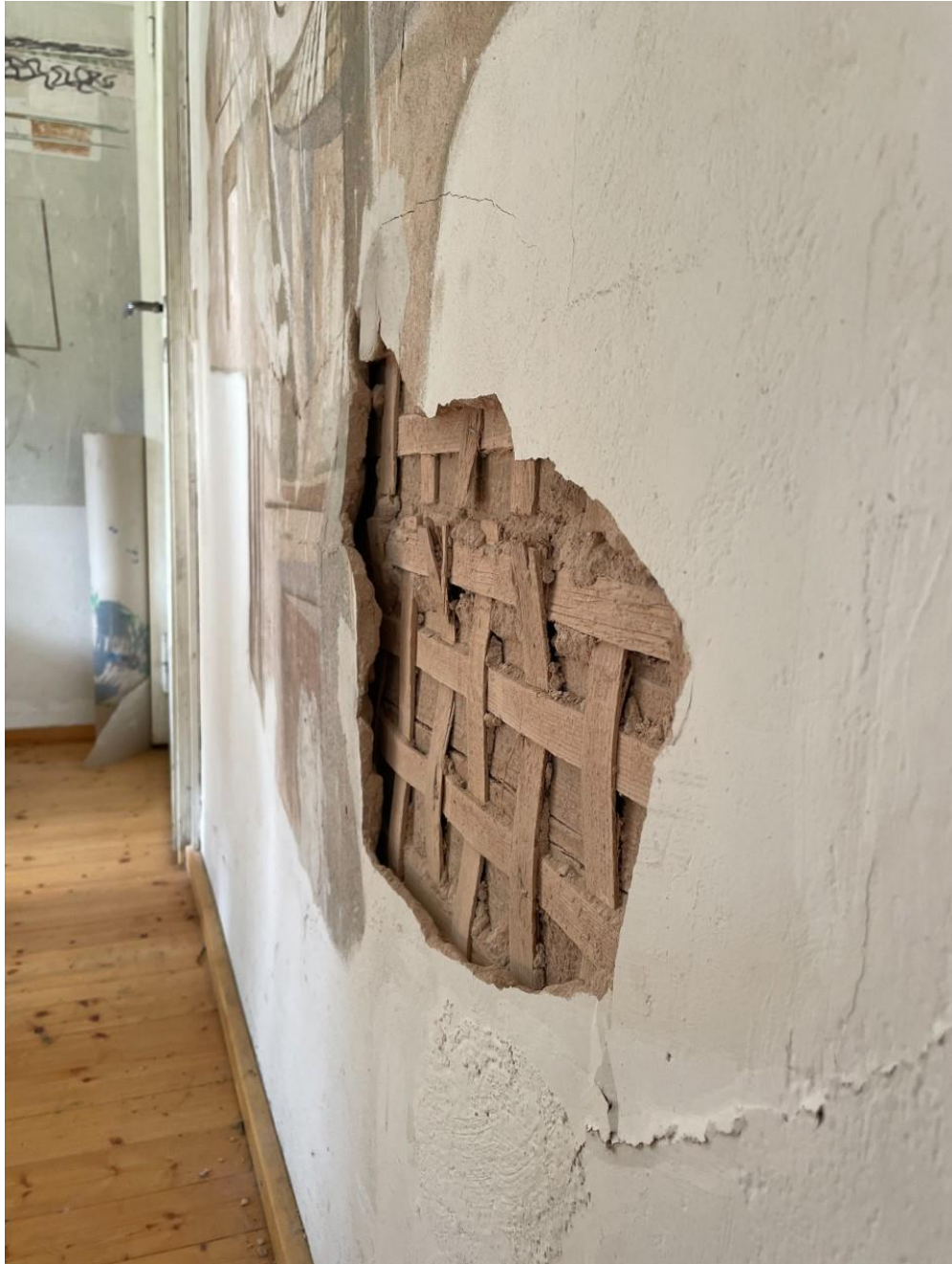
Foto 1 Krohvi seinast irdumine