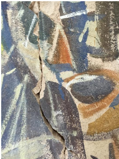
Foto 1 II korruse maali fragment