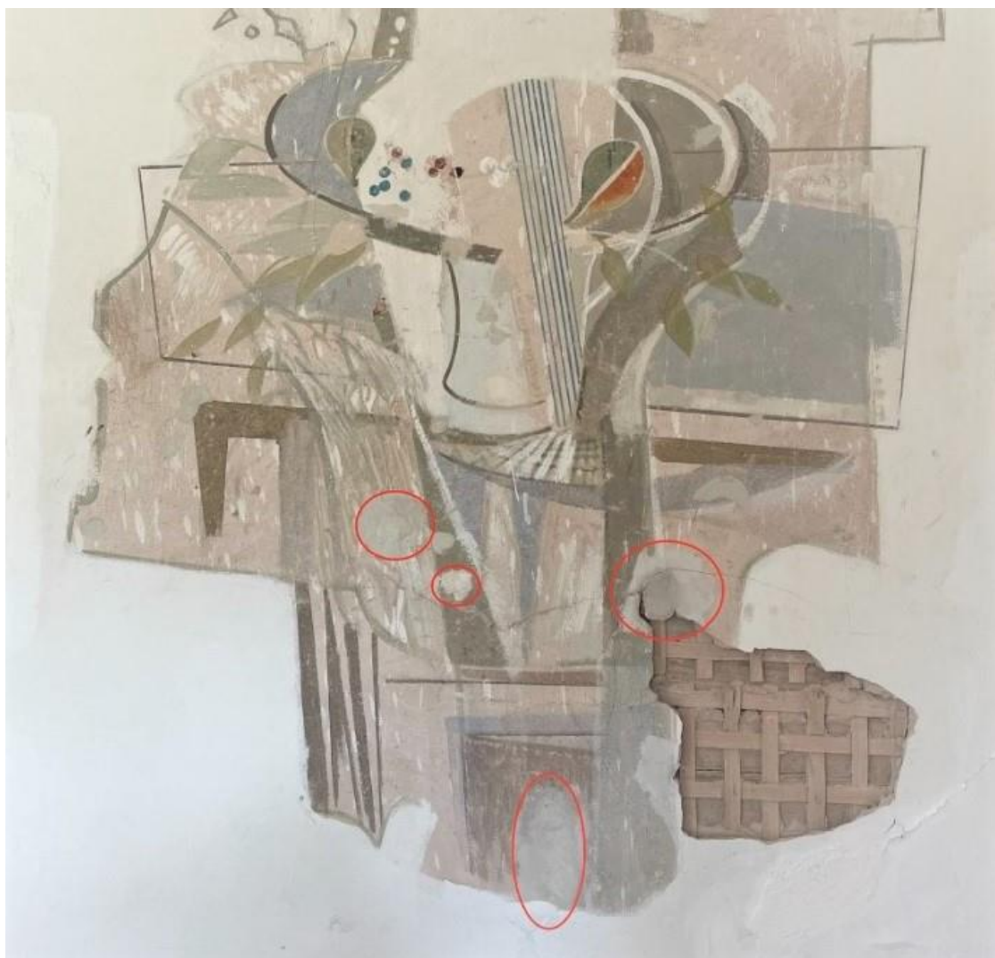
Foto 2 varasemate paranduste kohad