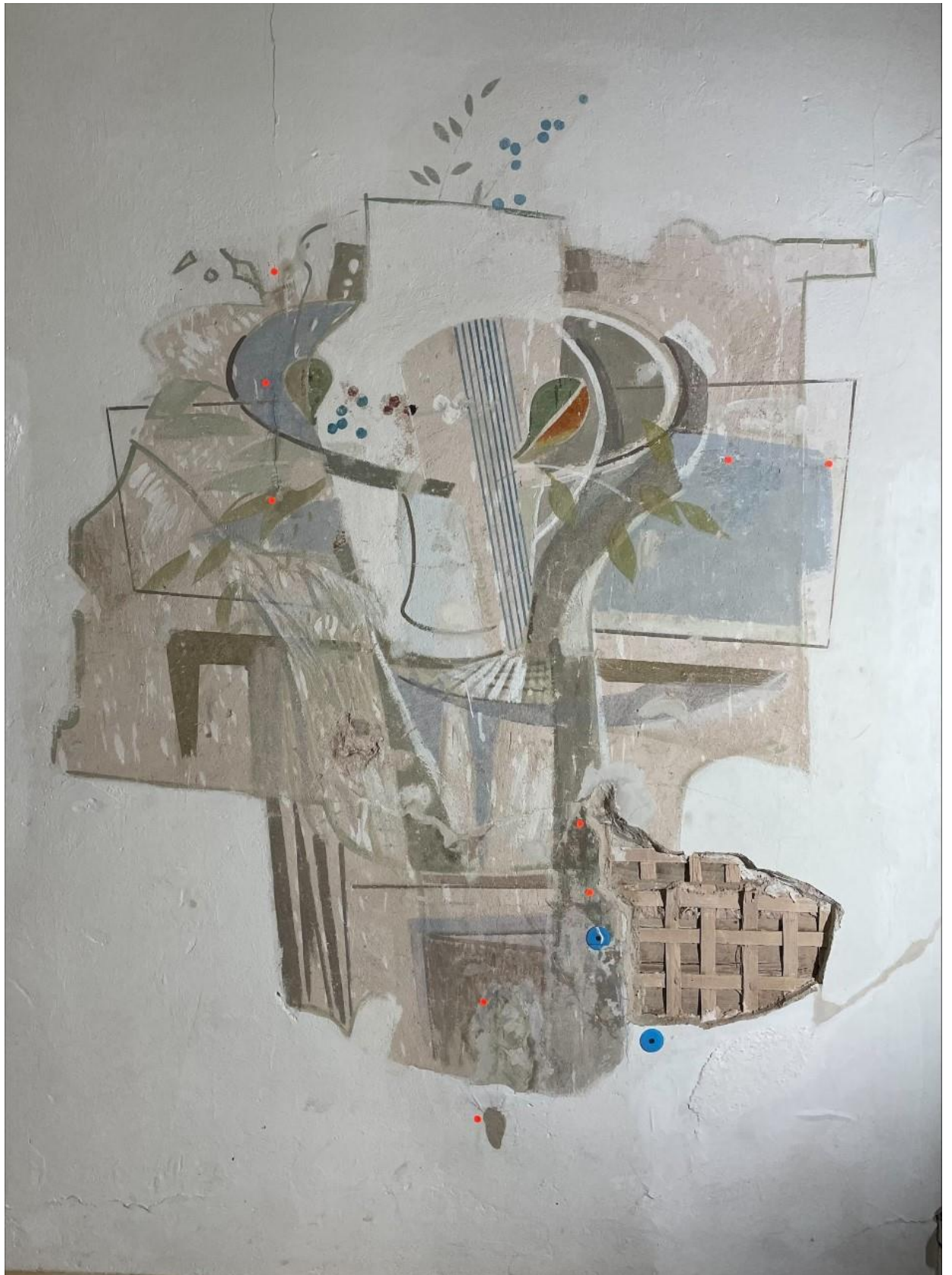
Foto 3 Seinamaaling peale avariikonserveerimist. Punasega märgitud injekeerimisega sisseviimise kohad.