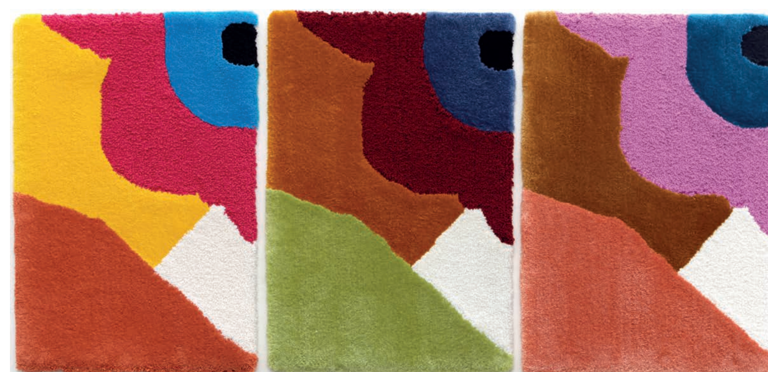
Lõputöö käigus valminud materjaliproovid vasakult: Spirit, Soul, Tencil.