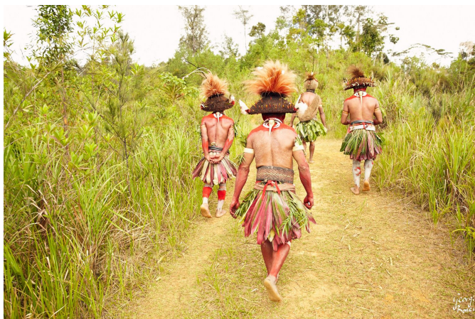
Pilt 4. Georgi Bonev. 2019. “Huli wigmen”

Üks lisanduv kaunistus, mida Huli wigmen -id kannavad on vagunokk-sarvlinnu nokk kukla peal (Vaata pilt 4). Nokk on märk tugevusest ja julgusest. Seda kaunistust kantakse ka festivalidel (Georgi Bonev. 2019).