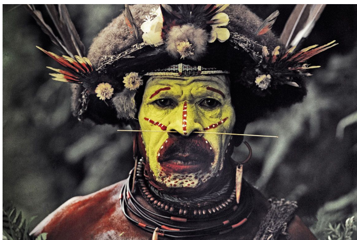
Pilt 1. Jimmy Nelson. 2010. “Knowledge is only rumour until it is in the muscle”

Rituaalide, festivalide ning muude sündmuste puhul on Huli -de jaoks tähtsal kohal keha-ja näomaalingud. Nad kasutavad näomaalingute puhul erksavärvilist kollast ja punast savi (Vaata pilt 1). Erksad värvid just sellepärast, et see äratav sõdalase neis endis ning viskab eemale hirmu. Samuti on kollane ( ambua ) ja punane ( momo ) savi nende jaoks püha (Hale Lahui. 2016).