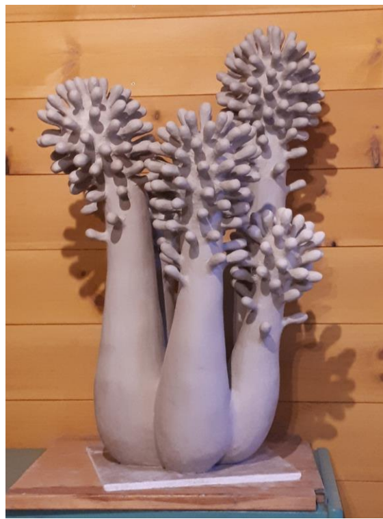
Kuivamisjärgus „Juurepess“