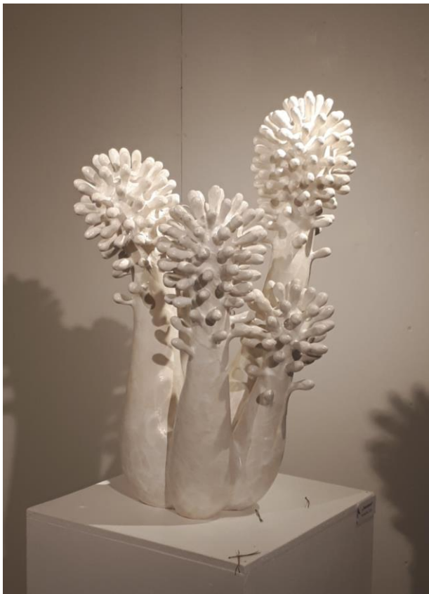
“Juurepess” näitusesaalis