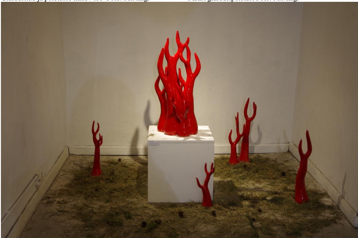
Näitusesaalis "Sarvik"