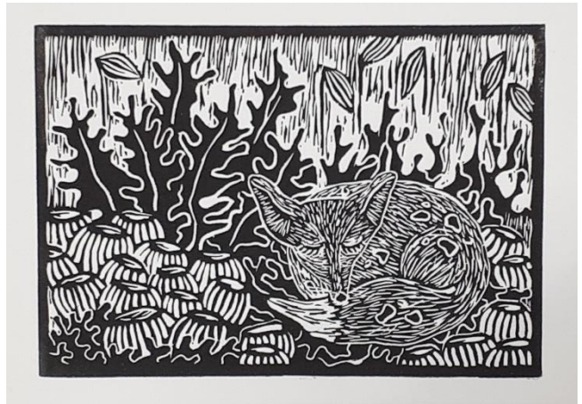
"Vulpes tåpiensis"