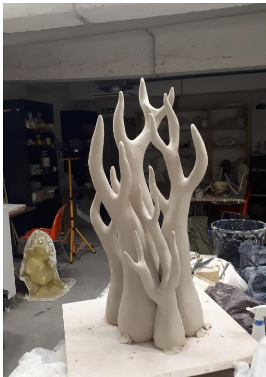
“Sarviku” varane modelleerimisjärg Foto: M.Mälgi Kuivamisstaadiumis Foto: M.Mälgi