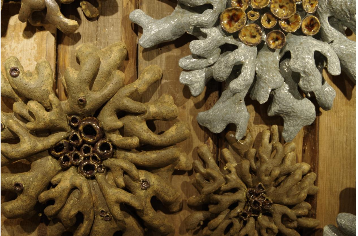
Detail reljefist