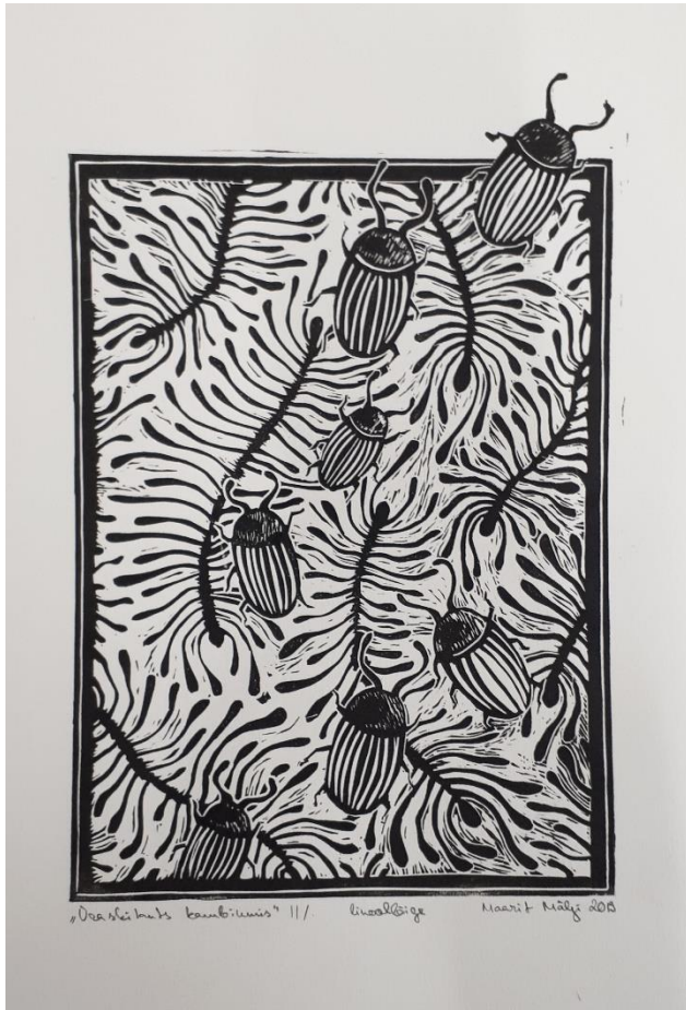
"Üraski tants kambiumis" // linoleum M. Mälgi 2003