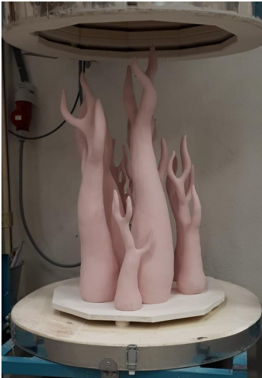
Glasuiritud ja põletusse minev töö