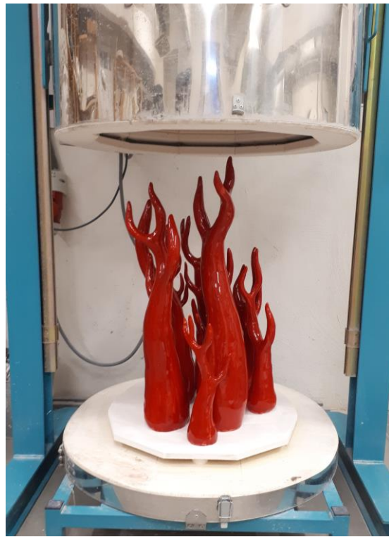
Pärast glasuuripõletust