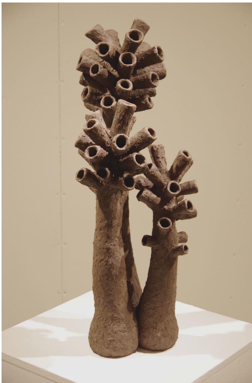
„Ürgsamblik“ näitusesaalis.

Kritseldustest sündinud kõrguv samblik, mis kõrgub nii mõnelgi mu loodust kujutaval joonistusel ning lõpuks hakkab kõrguma ka reaalsuses näituse postamendil. Toruja vormiga kaheksakümne viie sentimeetrini küündiv ürgaja elukas. Skulptuuri kõrgus 86 cm.