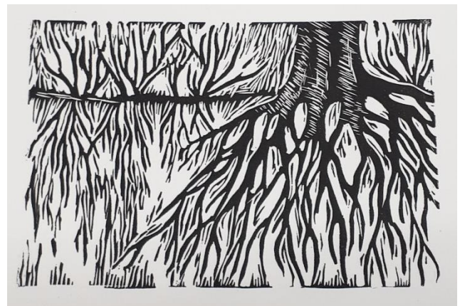
"Salajane elu"