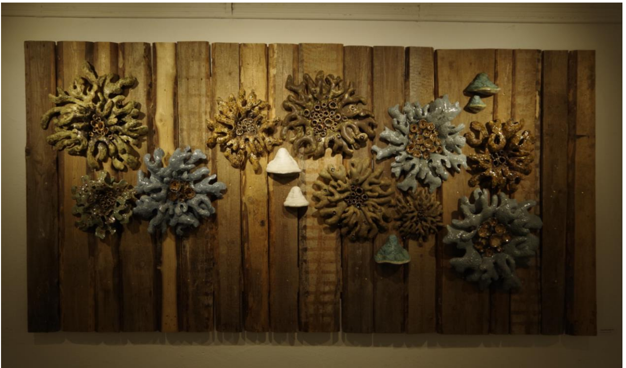
"Samblikupulm II"