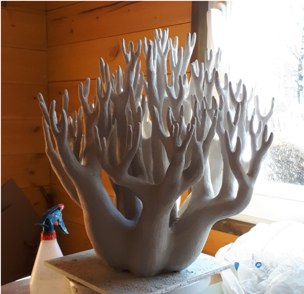
Kuivamisjärgus „Harik“