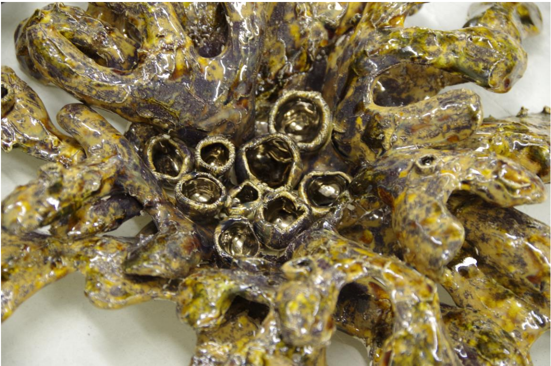
Glasuuri värvigamma