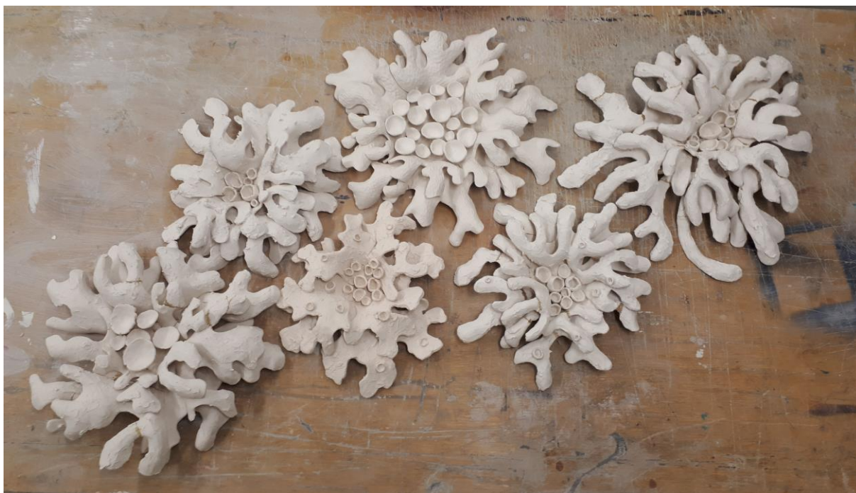
Eelpõletatud osad reljeefist „Samblikupulm II“

„Samblikupulm II“ on reljeef samblikest seinal, mis on üleelusuurused. Esialgse tõuke selle loomiseks sain kunagi aastaid tagasi mereääres kividel vaadeldes samblike kolooniat, kuidas erineva liigid on tihedasti üksteise kõrval ning loonud mustreid ja rütme oma paiknemisega.