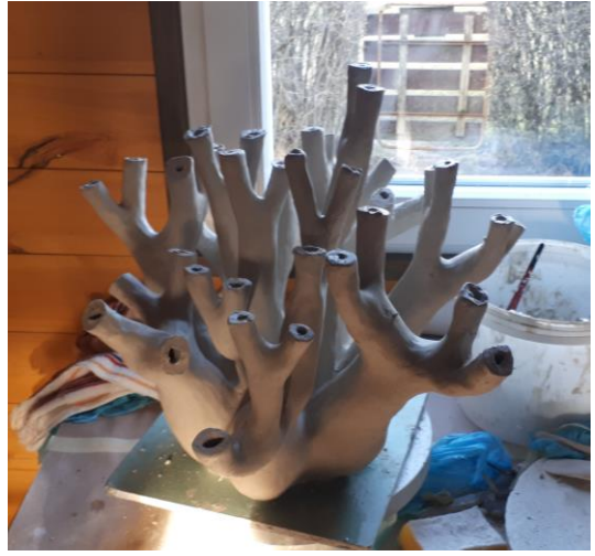
Modelleerimisjärgus „Harik“