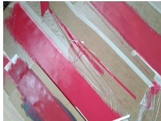
Foto 5. Punase värvi valimine.

Olen praegu omadega nii kaugel, et kui viimane paks värv abstraktsel osal piisavalt kuiv, et kannatab serva teibi kleepida pinna kaitseks, sai notsu valitud ja kinnitatud PVA liimiga. Katsin notsu kinni ja hakkasin pahteldama. Pahtlile tuli hiljem veel ka lillat tooni triip. Pildil on palju liikumist, erinevad pooldiagonaalsed suunad, need pidid omavahel sobima ja harmoneeruma. Mu pildil ongi kõige olulisemad rütm, liikumine ning värviharmonia. Vaja oli leida õige tasakaal intensiivsuse ja koguse vahel