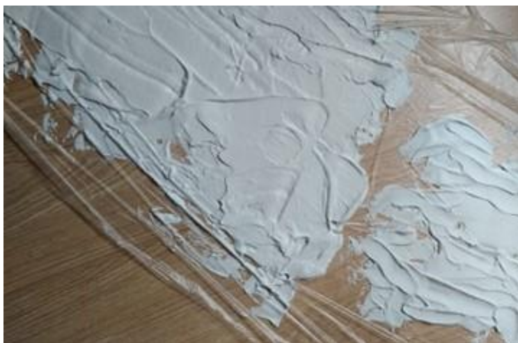
Foto 3. Pahtli katsetused.

Kogu see lõik peab kindlasti olema täpselt ühte tooni - naturaalne valge. Mulle meenutab see lund ja tuisku.