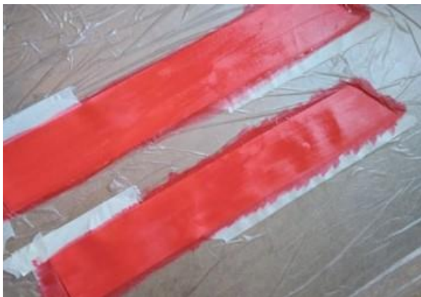
Foto 4. Punase värvi valimine.