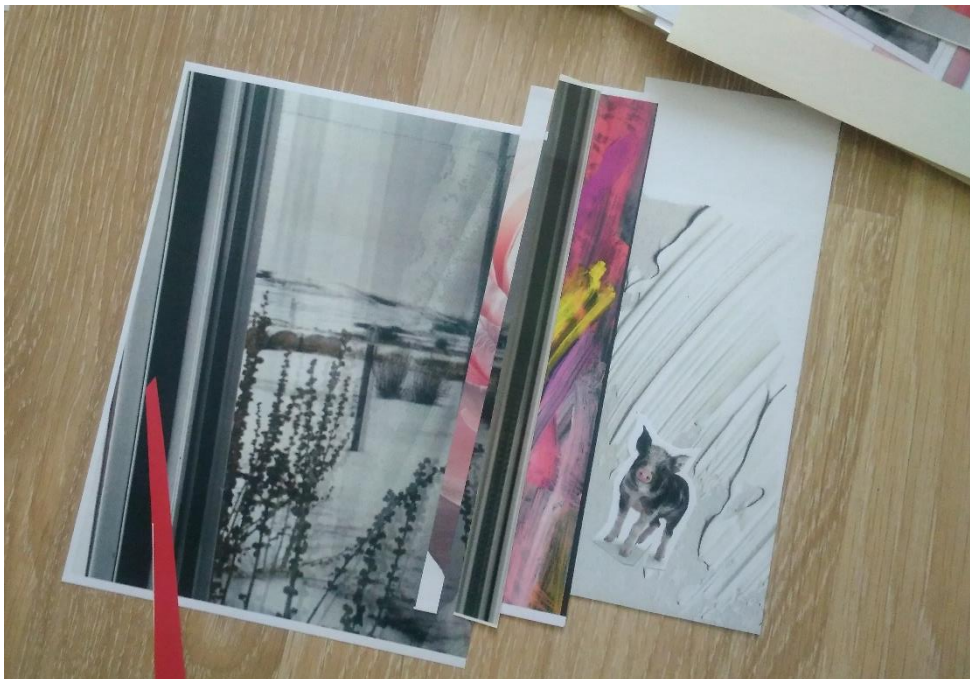
Foto 1. Kavandamine.

Tegin maalikavandi valmis. Komponeerisin, kuni jäin tulemusega rahule (Foto 1.). Loodud pilt meeldis mulle. Olen rahul, kui tunnen, et kõik on paigas, võin seda pilti lõputult vaadata, jäädagi vaatama, ei saa silmi pealt ega tüdine, kui tekib tervik. Väljapeetud värvilahendus, eri mustri- ja struktuuridetailid, kompositsioon, rütm. Õnnestunud kompositsioon tõmbab vaataja pilke. Kompositsiooniks võib nimetada igat motiivide ehk üksikelementide liitmist, kus need siis sulatatakse üheks tervikuks, olgu see siis lihtne või komplitseeritud lahendus. Seega on kompositsiooni mõtteks ja sisuliseks ülesandeks siduda omavahel üksikelemendid, millest kompositsioon koostatakse, ühendada need lahutamatuks tervikuks. Hea kompositsioon on selline, kust pole midagi ära võtta ega juurde lisada.