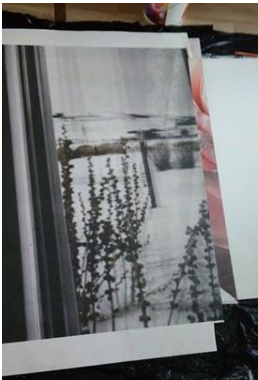
Foto 2. Fotolõuendi kleepimine.

Kui olin roosiriba ja fotolõuendi parajaks mõõtnud, välja lõiganud, pildile liiminud (Foto 2), sain veenduda, et kõik on tõesti liiga tume ja tuhm ning jätab töös hoopis erineva mulje sellest,