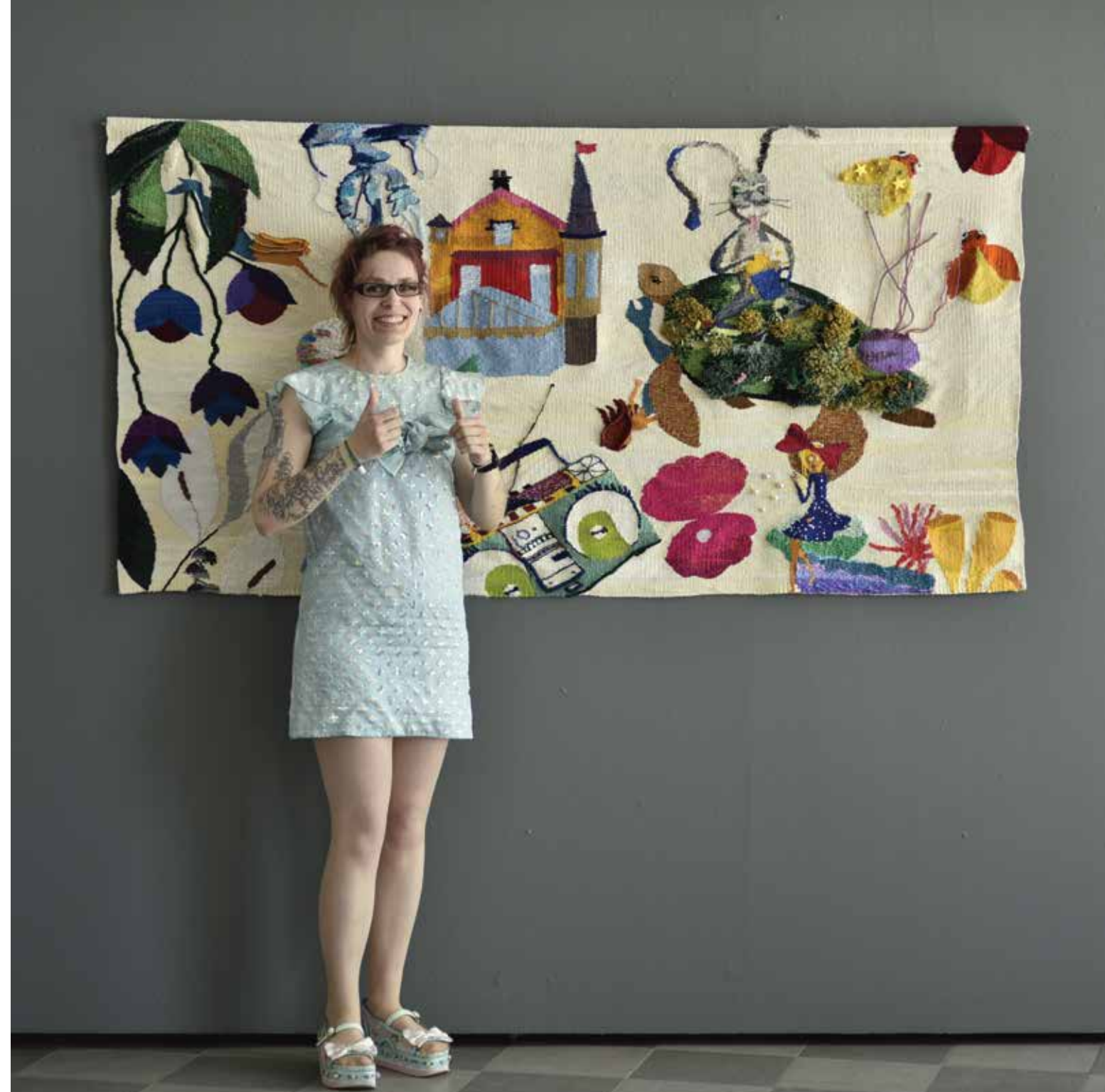
Valminud gobelään ja töö autor galeriis Noorus.