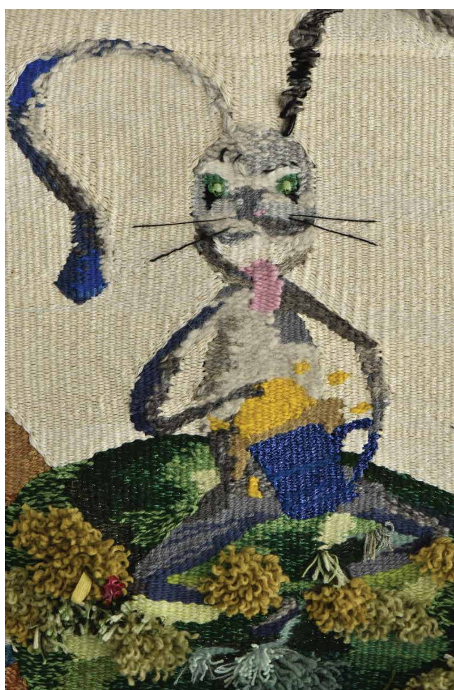
Hullumeelne kohvisõltlane kilpkonna peale kootud maailmas.

Sometimes its hard for an artist to put thoughts into words. Morning coffee is the beginning of a new, fresh day, but wording difficulties accumulate in the evening. My late-night coffee break is a mixture of imagination, passing in another subjective time and anti-reality is mixed with reality. The spirit is tired and can no longer limit and direct thoughts. I have time to analyze and go crazy, but at the same time I need