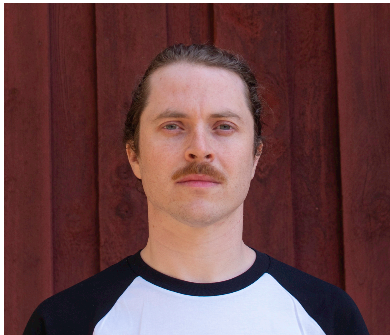
Fotol töö autor