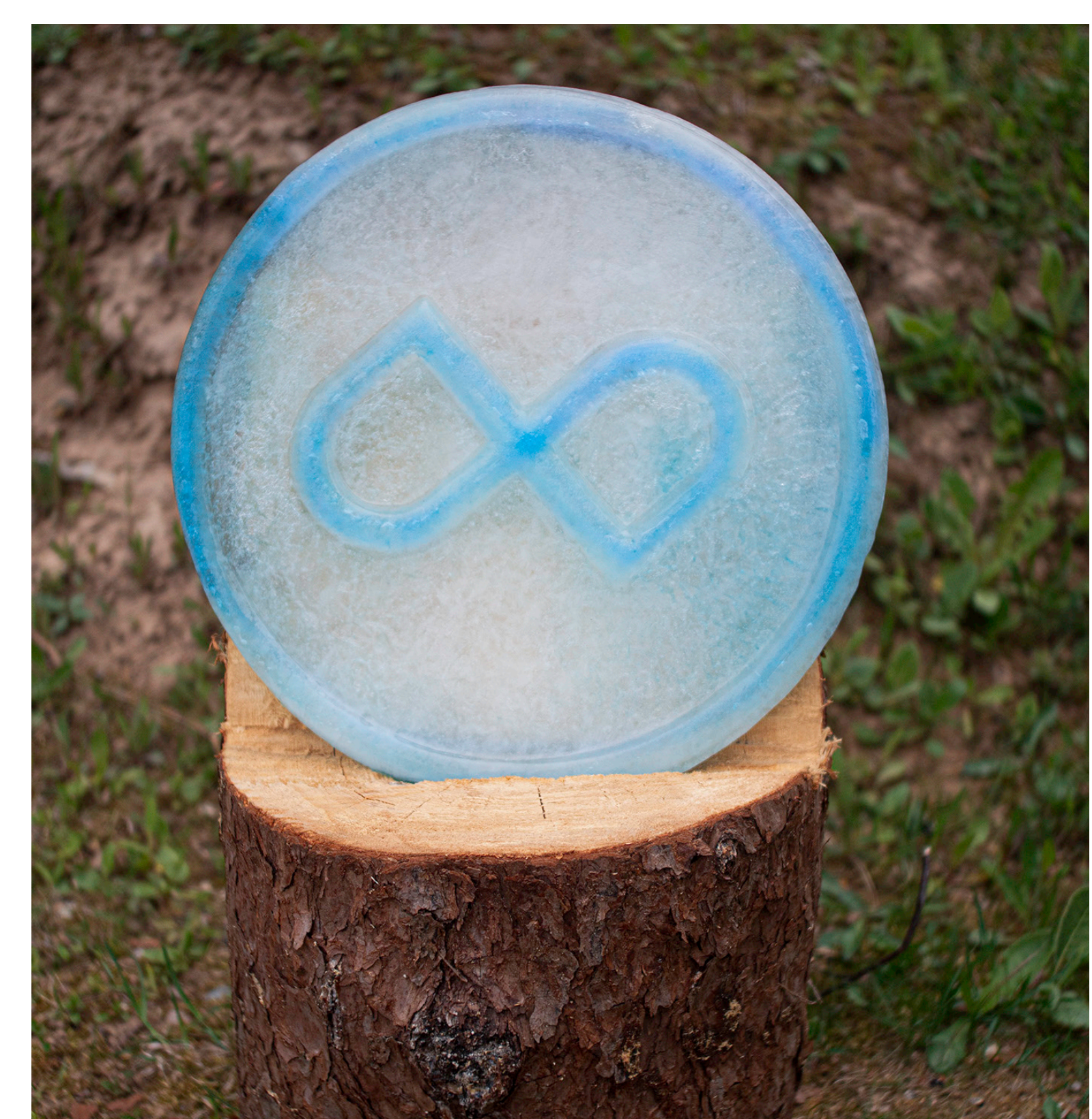
Fotol performance'il kasutatud jääskulptuur