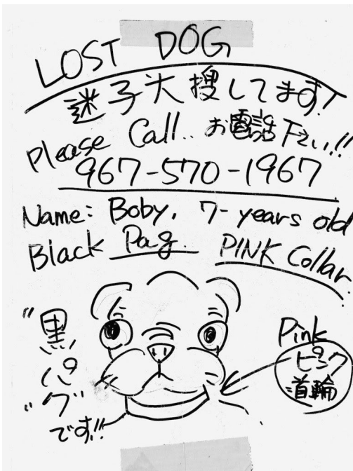
Plakati näide 3.