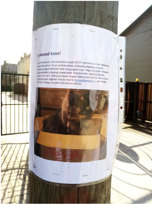
Plakati näide 1.