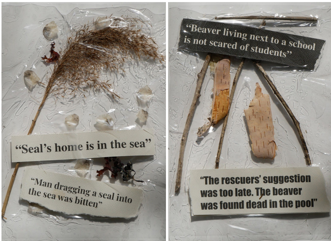
Joonis 4: Kiletatud objektid

Kuna tegemist on autori raamatuga, siis soovisin sellist meediumit maksimaalselt ära kasutada, et mitte teha lihtsalt raamatut, mida võiks suurtes kogustes trükkida, vaid midagi mis oleks unikaalne ning annaks kontseptsiooni hästi edasi. Plaan oli kasutada ajalehtedest leitud huvitavaid pealkirjasid juhtumite kohta, kus inimesed ja metsloomad on kokku puutunud. Selleks et need oleksid otseses seoses postritega, sai parimaks lahenduseks kasutada läbipaistvat materjali, millele pealkirjad lisada. Nii moodustavad pealkirjad ja postrid ühe terviku, mida saab muuta keerates lehte. Ainult pealkirjad kiletatud lehtedel oleksid olnud liiga tehnilikud ning inimesekesksed. Selleks et tuua raamatusse rohkem loodust ning emotsionaalset seost loodusega, lisasin pealkirjadele ka objektid otse loodusest. Kuuele plakatile, millel on põhifookus, lisasin kilelehed pealkirjade ja objektidega (Joonis 4).