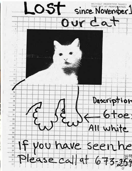
Plakati näide 2.