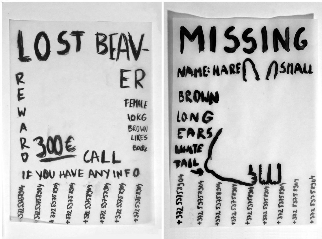
Joonis 3: Käsitsi joonistatud plakati osad

Plakatite puhul tegin kõik struktuurilt erinevad kuid stiililiselt piisavalt sarnased, et raamat püsiks tevikuna. Selleks kasutasin samu elemente: käsitsi kirjutatud tekste, ebatäpselt välja lõigatud fotosid mille rasteriseerisin, digitaalseid tekste ning eelpool mainitud illustratsioone. Illustratsioonides ja kujunduses proovisin jäljendada disainialaste teadmisteta inimeste plakateid, jäädes samas hea maitse juurde (Joonis 3). Plakatite jaoks oli vaja ka telefoninumbrit, mida neil kasutada. Selleks ostsin kõnekaardi ning kasutasin seda numbrit, et hiljem oleks võimalik kõnepost üles seada.