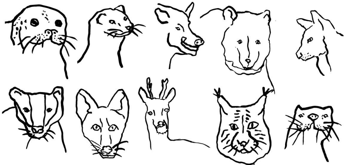
Joonis 2: Erinevad illustratsiooni katsetused