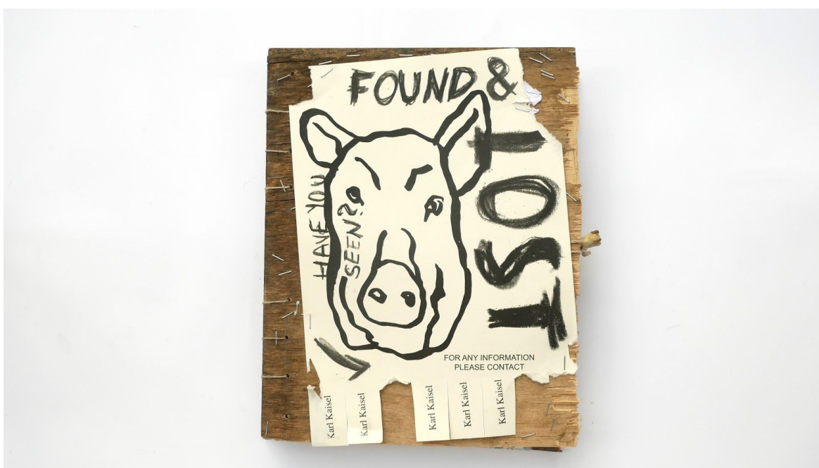
Joonis 1: Raamatu kaaned

Lõputöö praktilises osas disainisin ja kõitsin autoriraamatu “Found & Lost”. Raamat koosneb 42 leheküljest, millest 36 trükkisin tindiprinteriga 170g/m 2 paberile ning kuus lehekülge on kiletatud objektid ja tekst. Raamatu keskseks ideeks on kümme erinevat teost, mis imiteerivad plakateid. Raamatu kõitsin kopti stiilis. Illustratsioonid on kombinatsioonid fotodest, tuššijoonistustest, käsitsi kirjutatud tüpograafiast ja 3D elementidest. Raamatu kaaned (Joonis 1) valmistasin ilmastiku käes kahjustunud vineerist, millele on klambripüstoliga kinnitatud paberile trükitud illustratsioon.