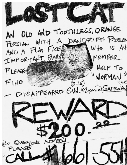
Plakati näide 4.