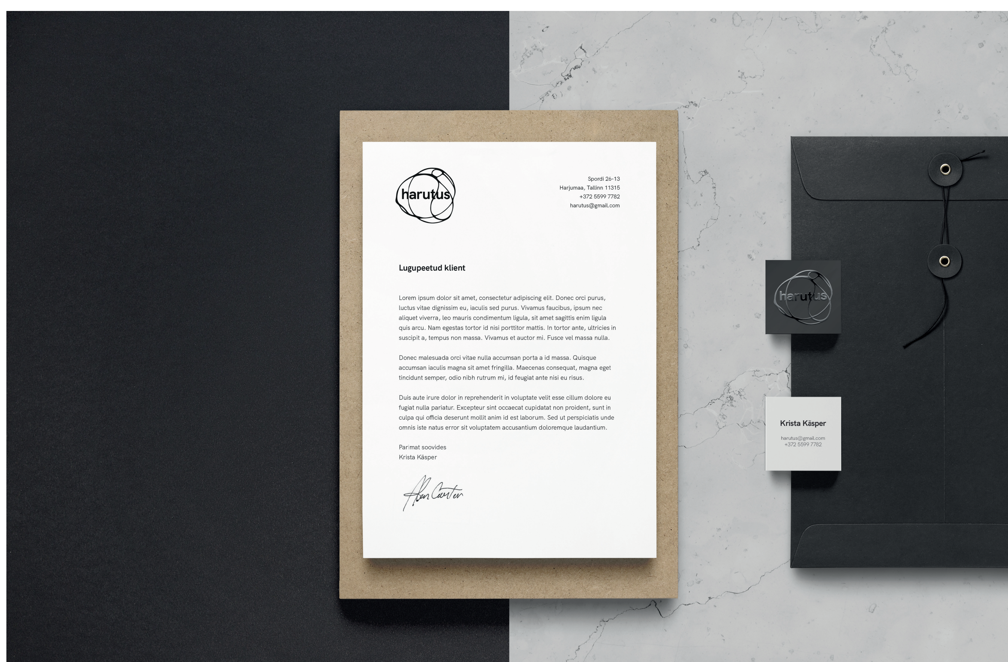
Blanketi ja visiitkaardi mock-up

In the second part of the work I describe the work process of designing a visual identity for the company Harutus. Harutus' visual identity is based on flexibility and motion. The creative process behind it is guided by instinct and luck, creating an identity that binds coincidental patterns with rules. The irregular and continuous thread motives describe the essence of the brand, reflecting the peculiarity of its products. It is built on the harmony of organic shapes that convey Harutus' uniqueness and unpredictability.