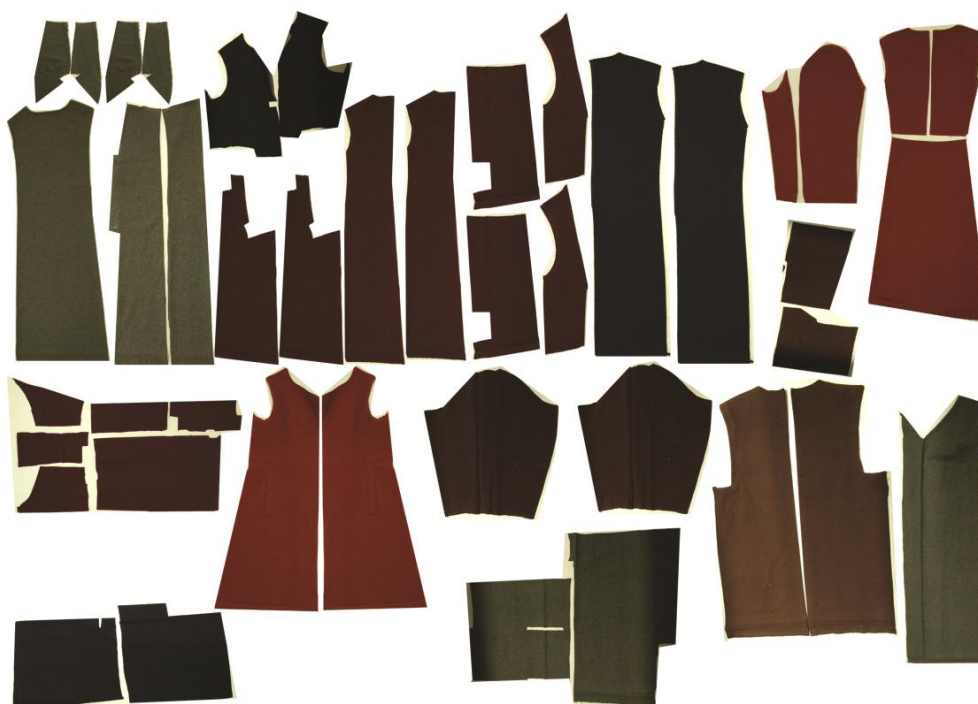
Foto nr. 11. Mantlid lahtivõetuna, kui suured kangatükid järele jäid. Kirsika Kolga .

Seejärel pesin kõik ülejäänud suured kangatükid pesumasinas 40°C vees, kasutades selleks spetsiaalset villa- ja siidšampooni. Pesumasina seadistasin villaprogrammile, mis on ilma tsentrifuugimiseta. Natukene oli kartus küll, et pärast pesumasinast materjali kättesaamist on