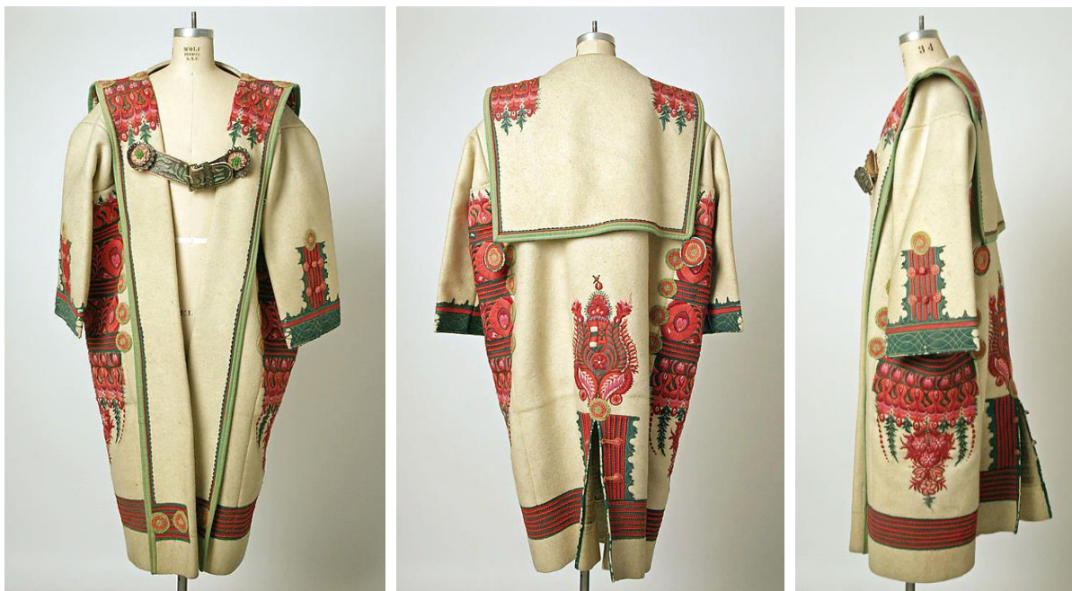
Foto nr. 5. Szür mantel eest-, tagant. ning külgsvaates.

elemendid lõigati kartongist, seda kasutati mallina, mida tikandi tegija käsitles vabalt. Kõige soositumad lillemotiivid on roosid, roospungad, nelgid ja tulbid. (Gervers-Molnar 1973: 33-36)