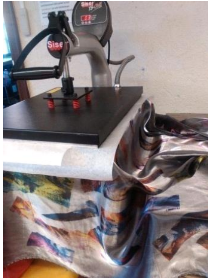
Foto nr. 14. Voodririie kuumpressi

Siirdetrükki teostada on lihtne. Meeles tuleb pidada, et lillepaber asetatakse kangale parempool vastu kangast. Kasutasin kuumpressi temperatuuril 190° kraadi ja 30 sekundit.