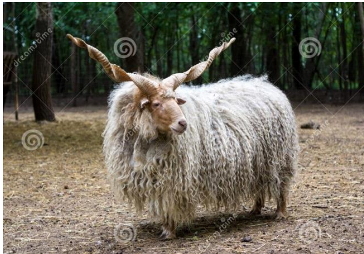
Foto nr. 3. Racka lammas.