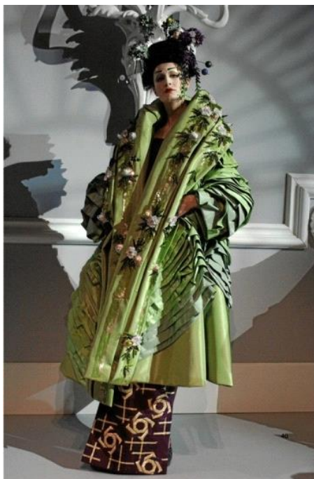
Foto nr. 6. John Galliano, mudel "Gia-Cia-Me-San", kevad-suve 2007 kolleksioon Dior Haute Couture