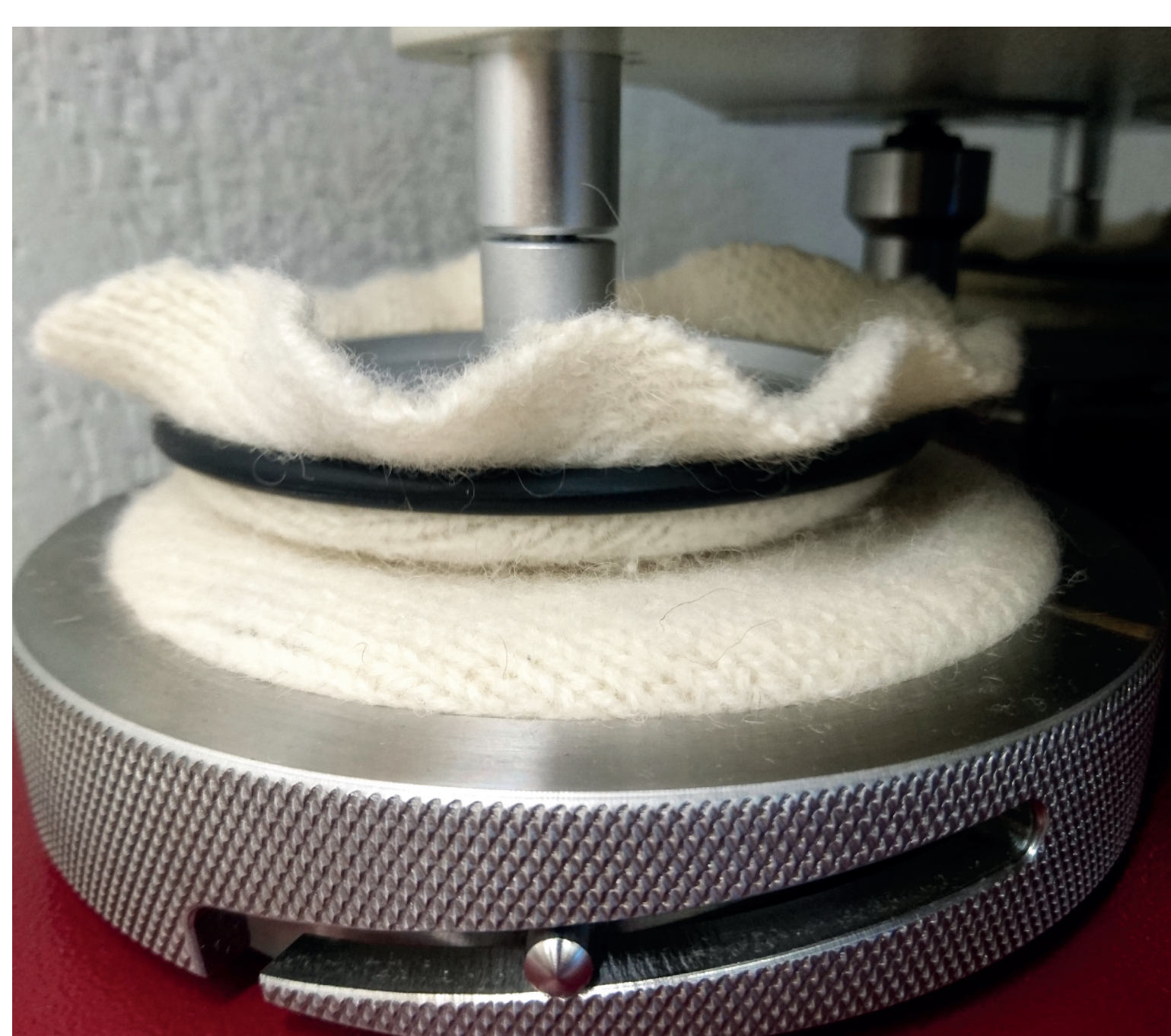
Pillingutest silmuskoetud ja vanutatud villasele kangale.