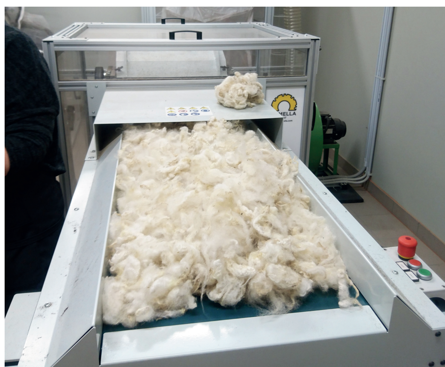
TÜ VKA Vilma villakoja villahunt.

In the course of applied research I got acquainted with Estonian wool factories in order to get an overview of the production possibilities of woollen yarn. I chose nine yarns from different factories in order to test their properties for making a knitted product. I carried out several technological tests on the knitted fabrics made of these yarns. On the basis of test results I created knitted items for getting an experience of the uses of this material in the design of knitwear.