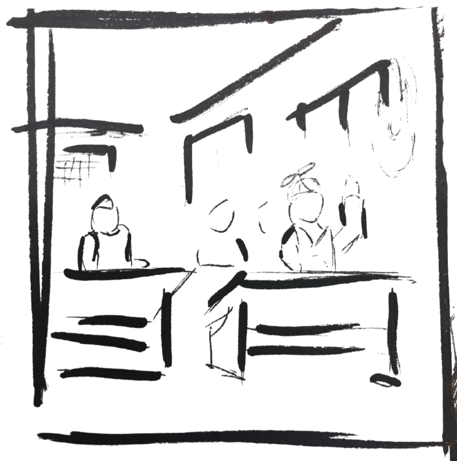
TÄISKASVANUD IMESED KOOLIPINGIS, SELJAS RIHETUS MIDA VÕIKSID KANDA ESIMESE KLASSI LAPSED.