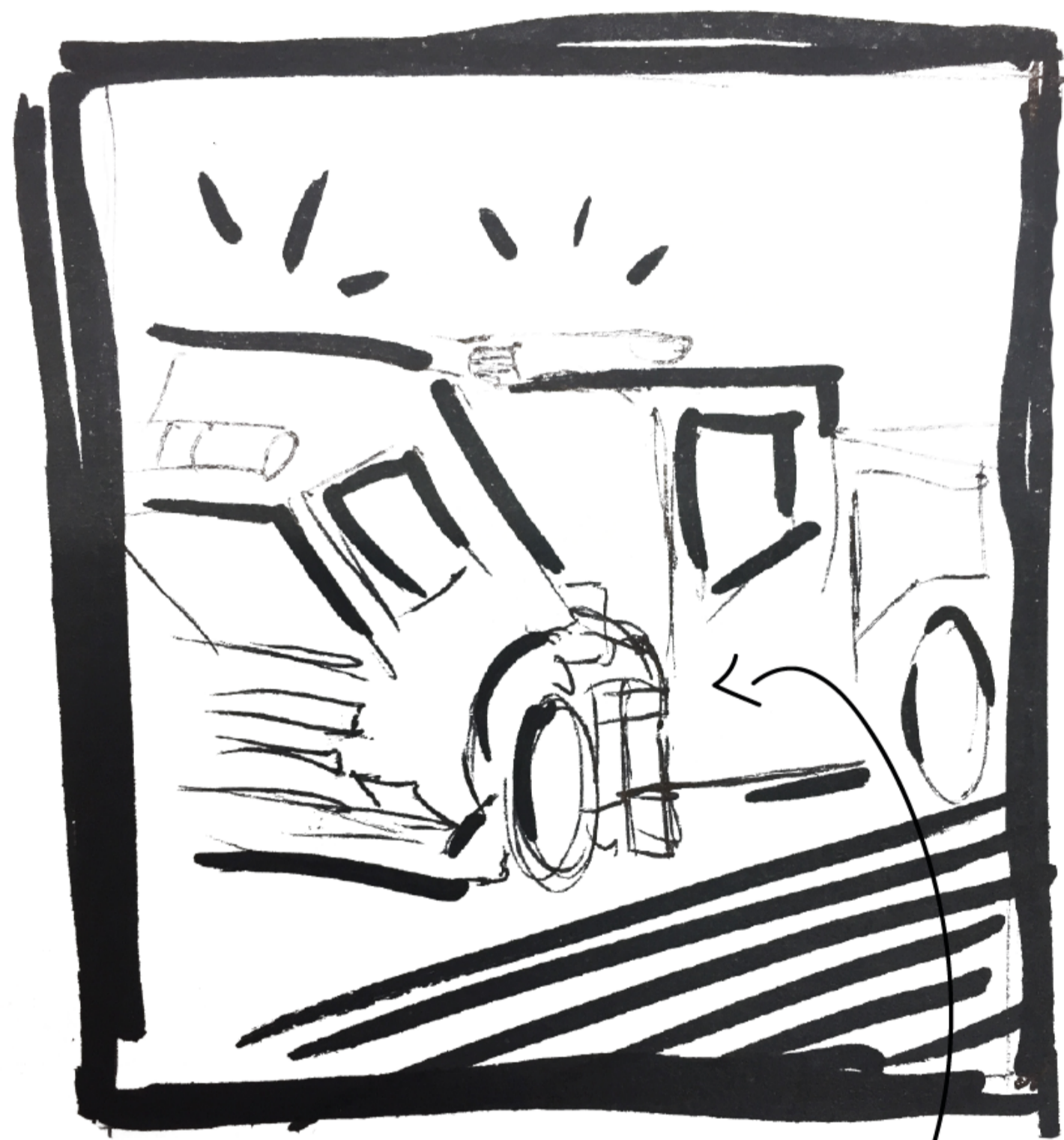
TULETÖRJUJA AUTOT REMONTIMAS.

Ülesande puhul proovisin leida erinevaid moodulmajadega seotud mõttekäike. Üritasin leida analooge moodulmajade ja LEGO majade vahel. Lisaks tuli meelde ka IKEA kokkupandav mööbel. Lõpuks leidsin suuna, mis kirjeldas inimese soovi teha midagi suuremat, kui tema praegune töökoht võimaldab.