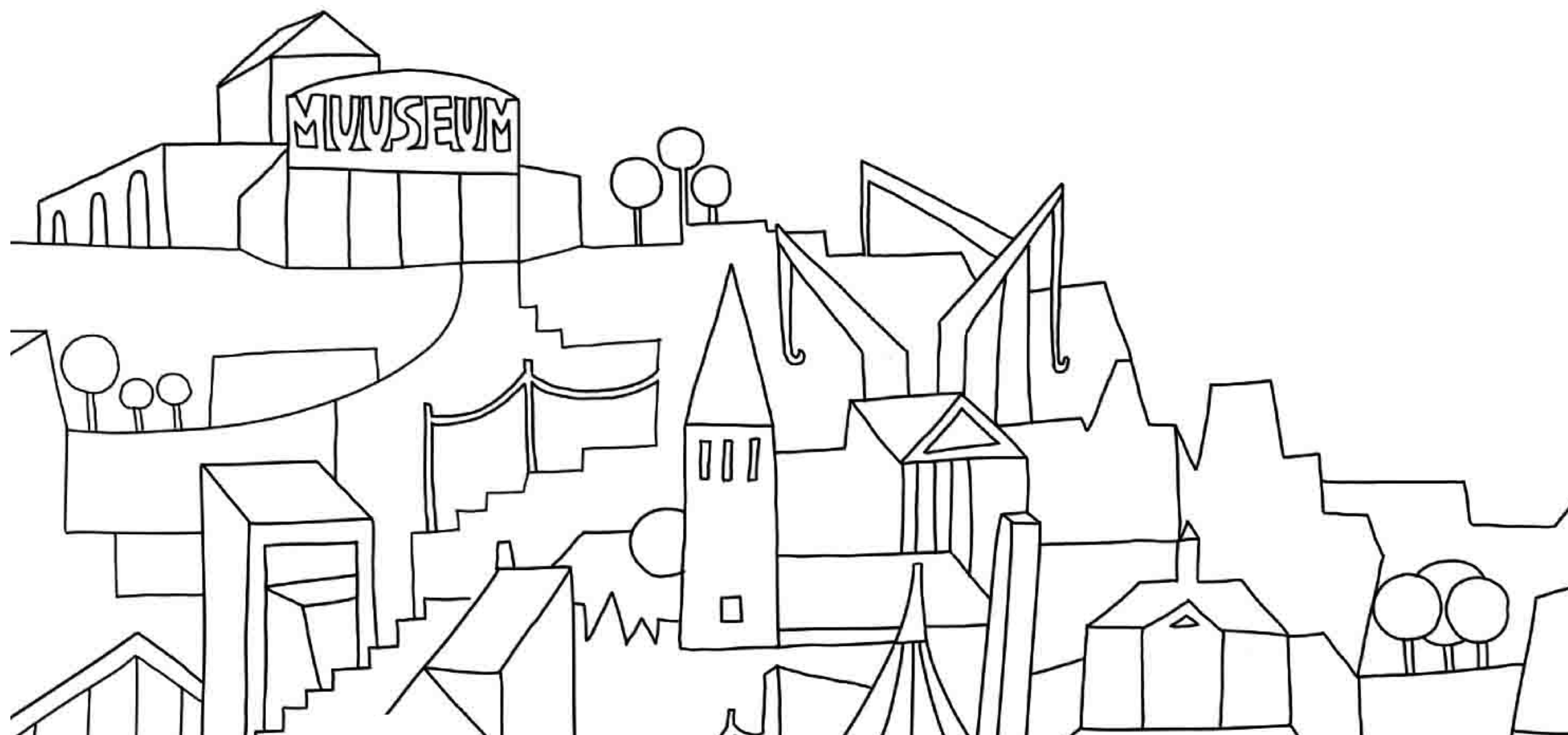
Kaader animatsioonist “Kõhkleja”

KAHJUKS on mind ainult üks... Kuigi pole päriselt võimalik mitmekordistuda ning kogeda korraga mitut maailma, siis tatmine kõike teha püsib ning see võib mind muuta otsustusvõimetuks. Sellise seisundi - suutmatusena teha valikuid ehk otsustusparalüüsi uurimisega tegeleb minu lõputöö.