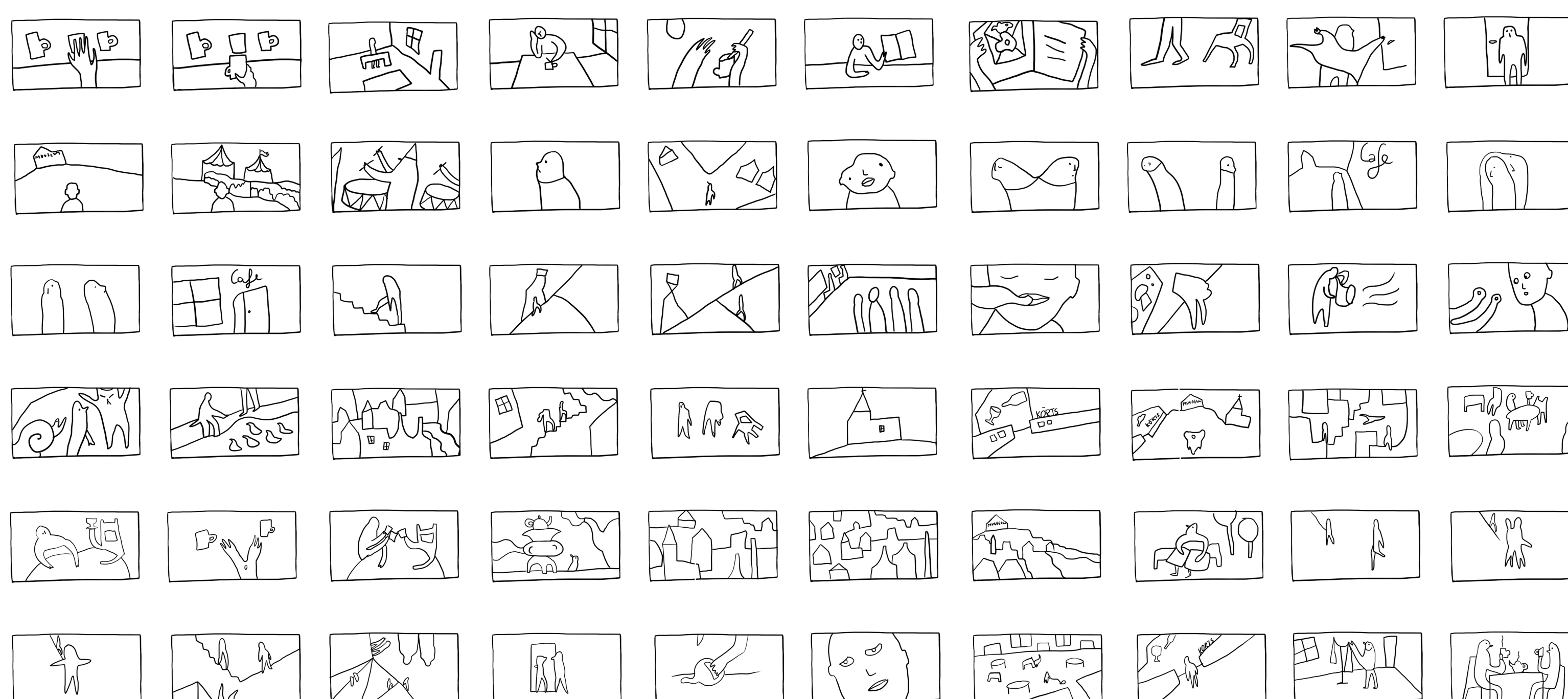
Animatsiooni “Kõhkleja” piltstsenarium

Unfortunately there is only one “me”. Although it is not really possible to multiply and experience multiple worlds at the same time, the will to do everything remains and I can get into decision paralysis. My graduation project deals with such a state of mind - the inability to make choices, or investigating the decision paralysis.